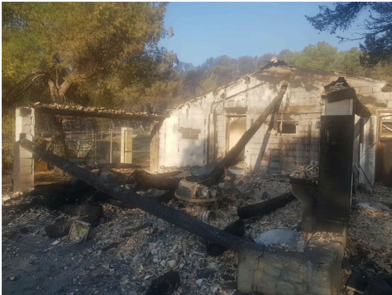
Dégâts constatés par la commune de Barbentane.