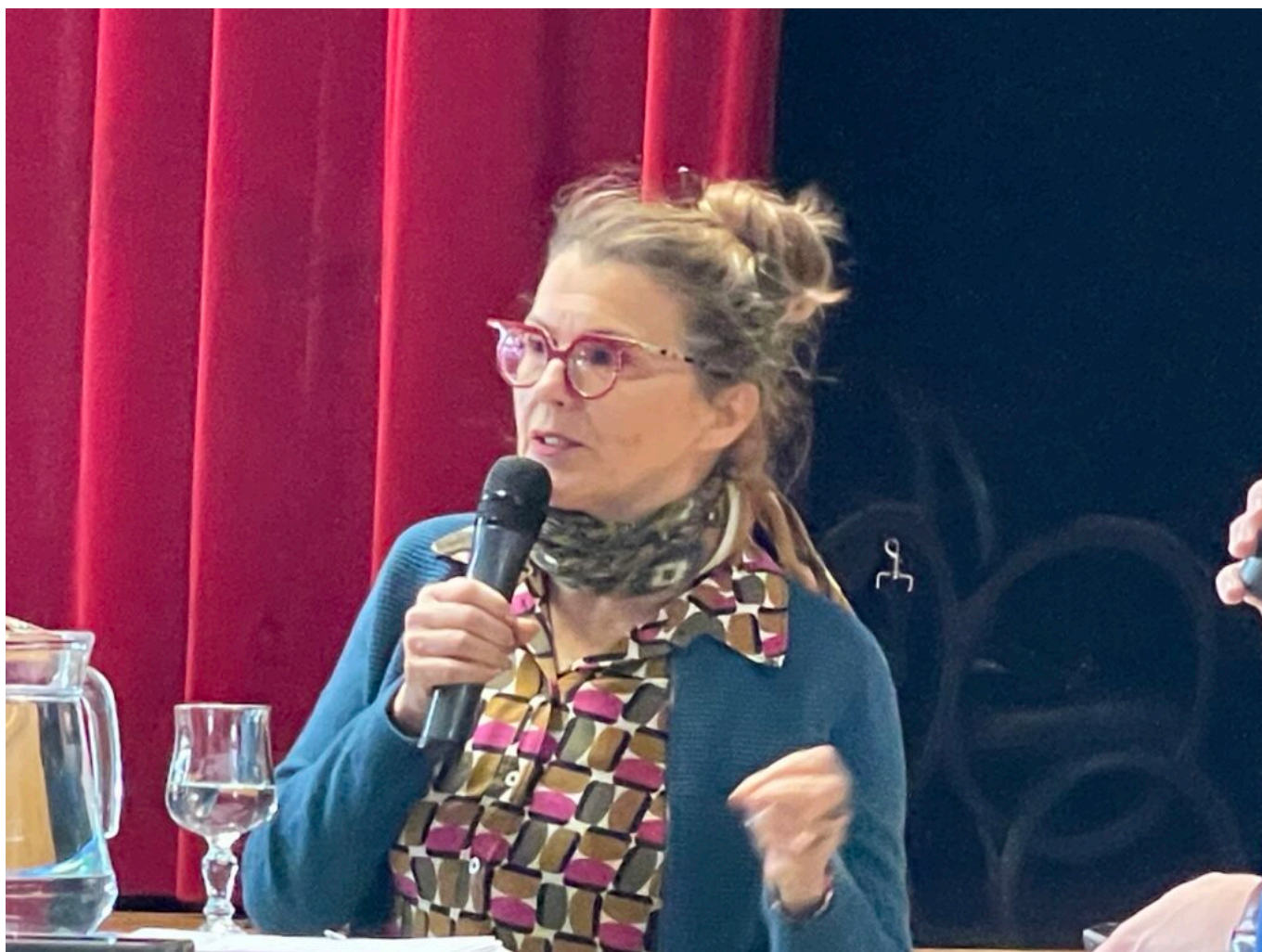
Nathalie Gontard Copyright MMH

Ecrit par Mireille Hurlin le 25 mars 2025