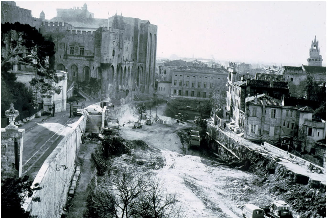
La construction du parking du palais des papes.

Ecrit par Laurent Garcia le 28 avril 2022