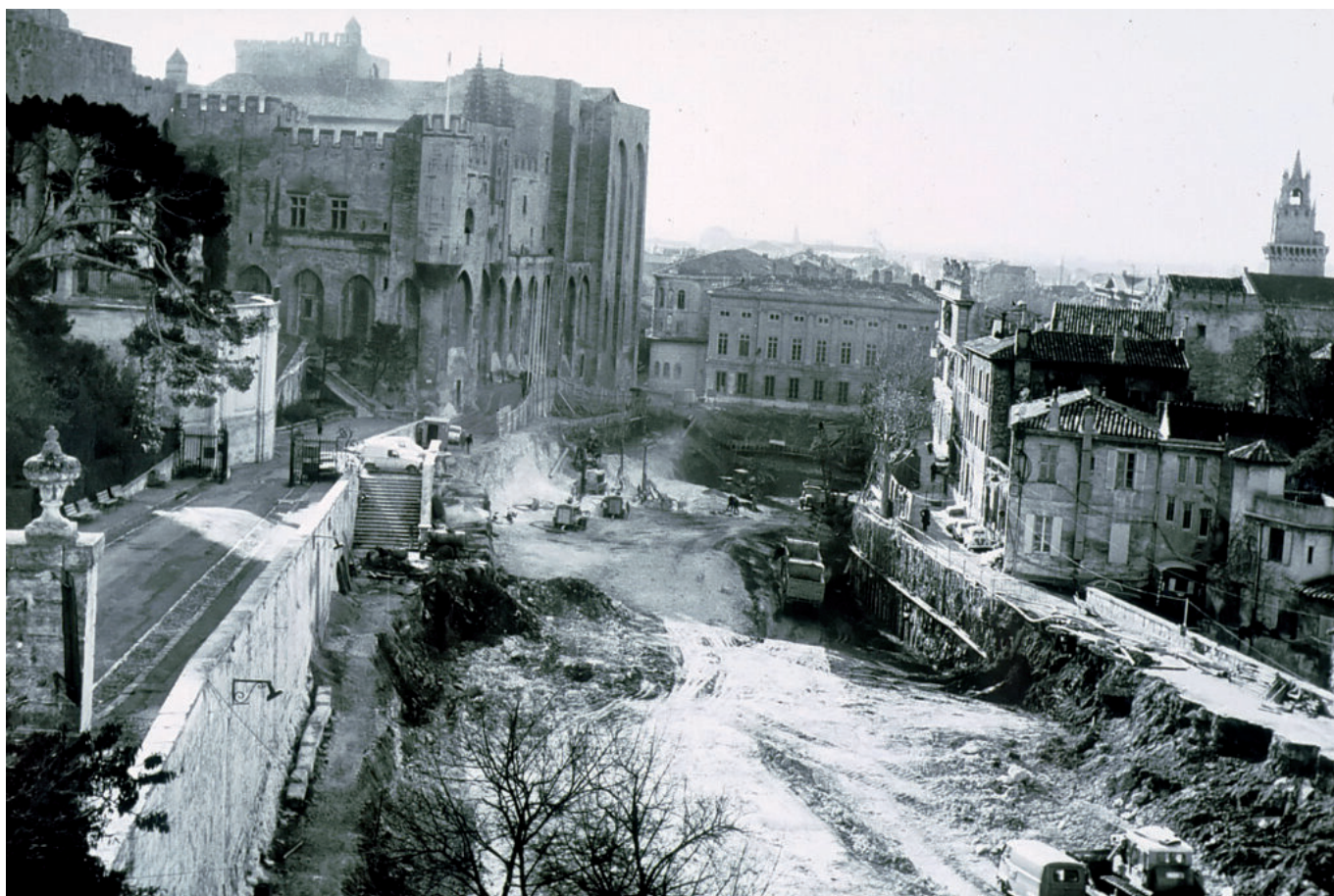
La construction du parking du palais des papes.

Ecrit par Laurent Garcia le 28 avril 2022