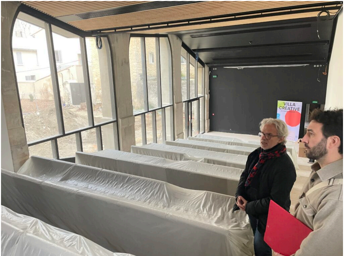
L'auditorium présenté par l'architecte Alfonso Femia et DLLA Architectes

Ecrit par Mireille Hurlin le 28 janvier 2025