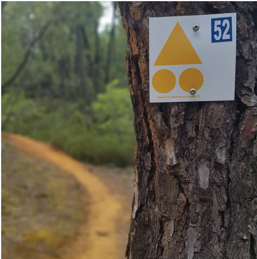
Exemple de balise.

Ecrit par Vanessa Arnal le 19 décembre 2024