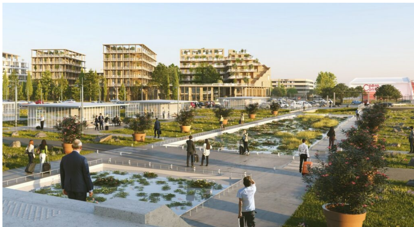
Le 1er macro-lot d'Avignon-Confluences vu depuis le parvis de la gare. ©Leclercq Associés &

Il faut dire qu'en guise de cadeau d'adieu, beaucoup pointent du doigt en 'off' une ministre, aussi rancunière que malheureuse après des élections municipales perdue à Avignon en 2001, d'avoir eu 'la bonne idée d'œuvrer' à ce que l'évaluation des risques d'inondation ne soit plus estimée par rapport à une crue centennale mais par rapport à une crue millénaire. Et histoire de bien verrouiller l'affaire, outre le Rhône, ce risque avait été aussi étendu à la Durance. Pas étonnant dans ces conditions que les programmes apparaissent au compte-gouttes et qu'il soit difficile de réaliser des projets d'envergures comprenant notamment un geste architectural emblématique.