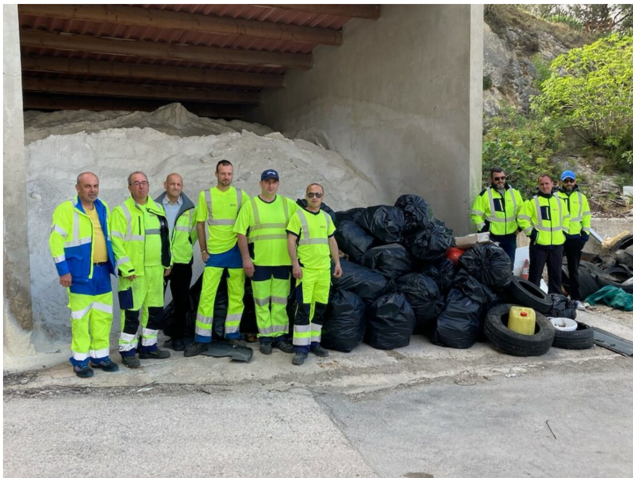
Les déchets qui ont été collectés aux alentours de Cavaillon.

À Cavaillon par exemple, sur 20 km d'accotement des RD938 et RD973, environ 50 sacs de 100 litres ont été remplis, donc 5 mètres cubes de déchets ont été ramassés. Parmi les déchets collectés dans les différentes communes, il y avait des encombrants, des déchets plastiques, mélangés, métalliques et pneumatiques, du carton, des déchets verts, ou encore des cadavres d'animaux.