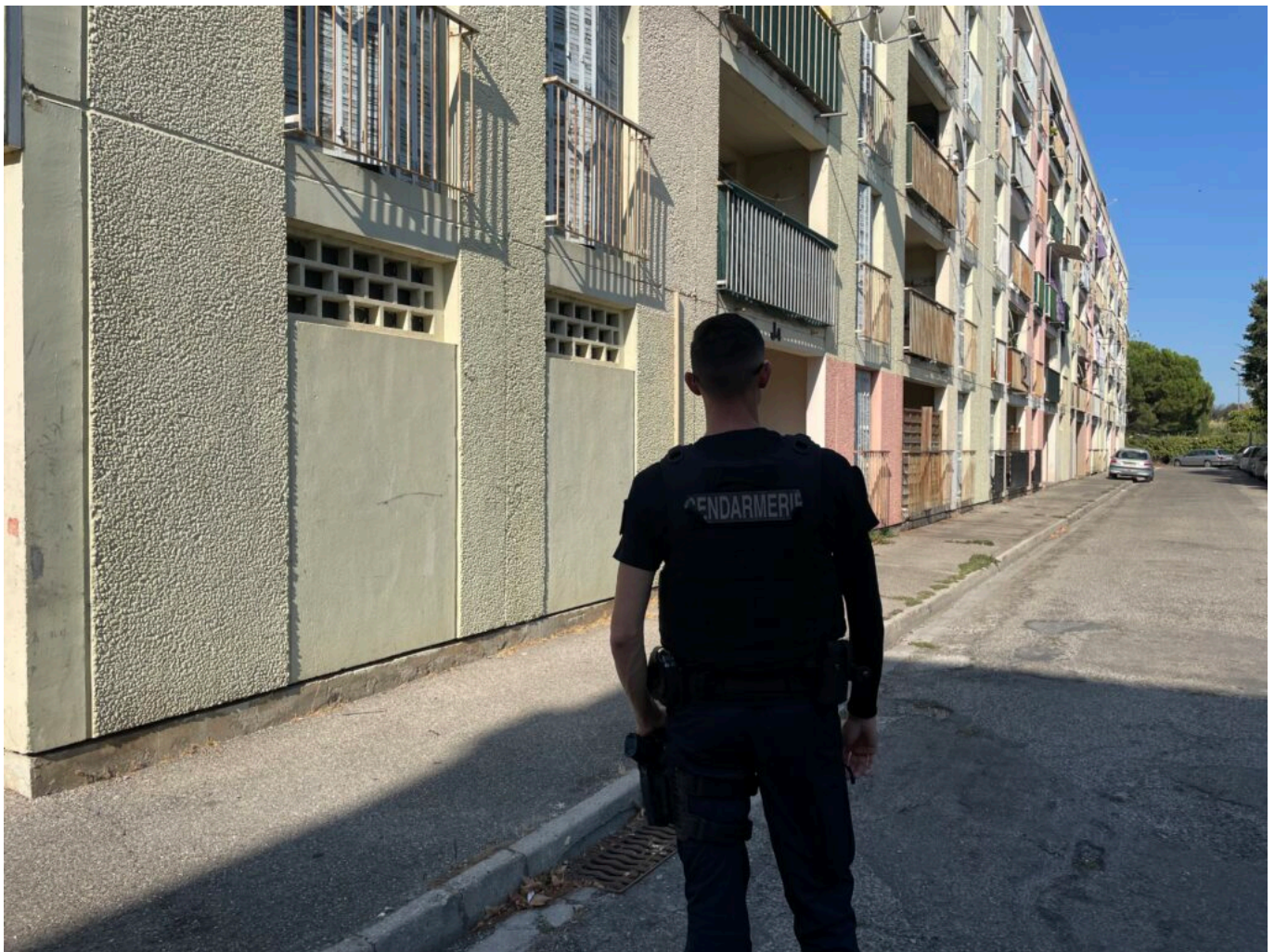
Cité l'Establet à Sorgues lors d'une opération conjointe Gendarmerie et Police municipale

Certains prénoms ont été changés par mesure de confidentialité.