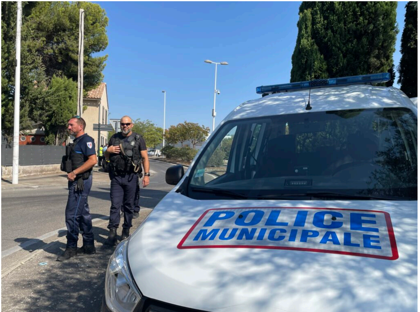
Police municipale de Sorgues, ils seront bientôt 30 à assurer la sécurité.

Ecrit par Mireille Hurlin le 16 août 2022