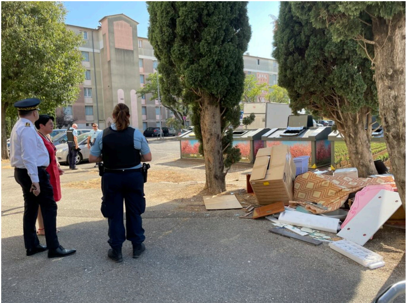
Cité l'Establet à Sorgues, patrimoine de Vallis Habitat

Ecrit par Mireille Hurlin le 16 août 2022