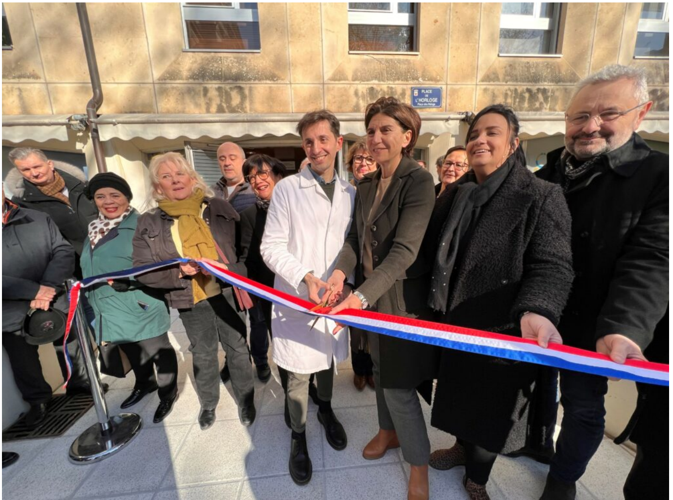
Inauguration du centre du Réseau Départemental de Santé, nouvellement ouvert place de l'Horloge à Avignon.

Il poursuit : « Ici, je vais pouvoir me concentrer sur le patient, le suivre dans la durée, avec une prise en charge globale comme médecin traitant. Je travaille du lundi au vendredi de 9h à 18h, après je vais gérer ma vie privée comme je l'entends, profiter des paysages, des randonnées, des loisirs, de la vie culturelle, du climat du Vaucluse ».