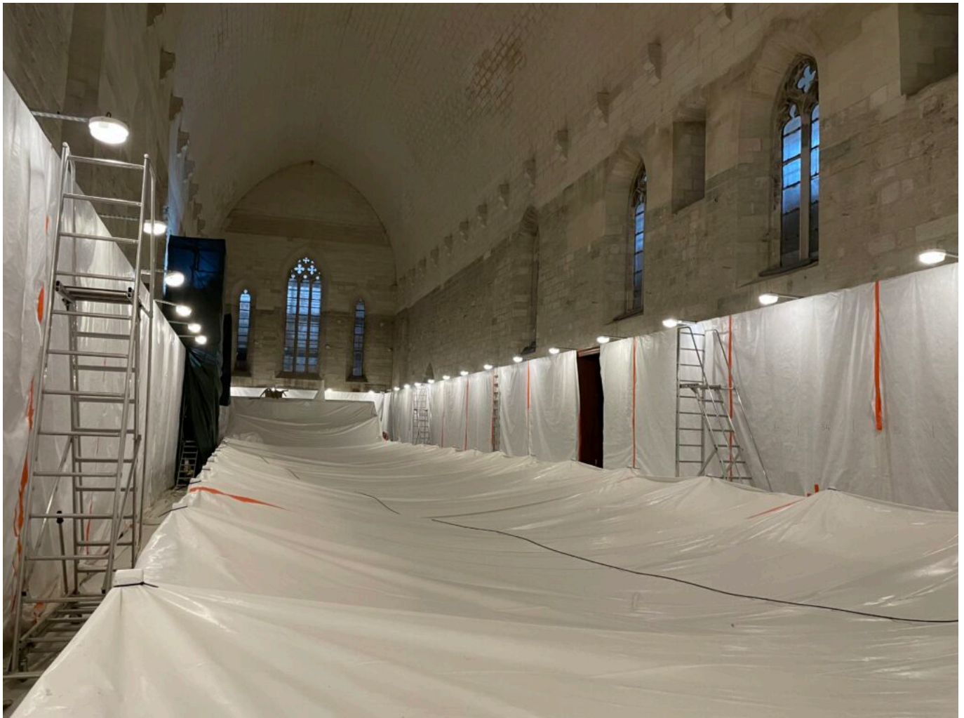
La Chapelle Benoît XII entièrement bâchée