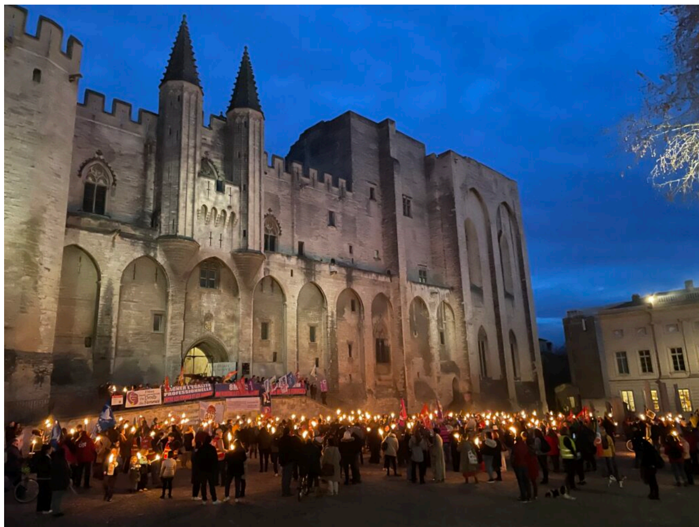
Manifestation au flambeau contre la réforme des retraites le soir du 8 mars devant le Palais des papes