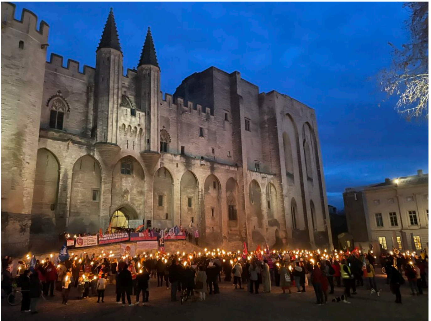
Manifestation au flambeau contre la réforme des retraites le soir du 8 mars devant le Palais des papes

Lucien Stanzione est membre de la Commission de la Culture, de l'éducation et de la communication et de la délégation aux Collectivités territoriales et à la décentralisation.