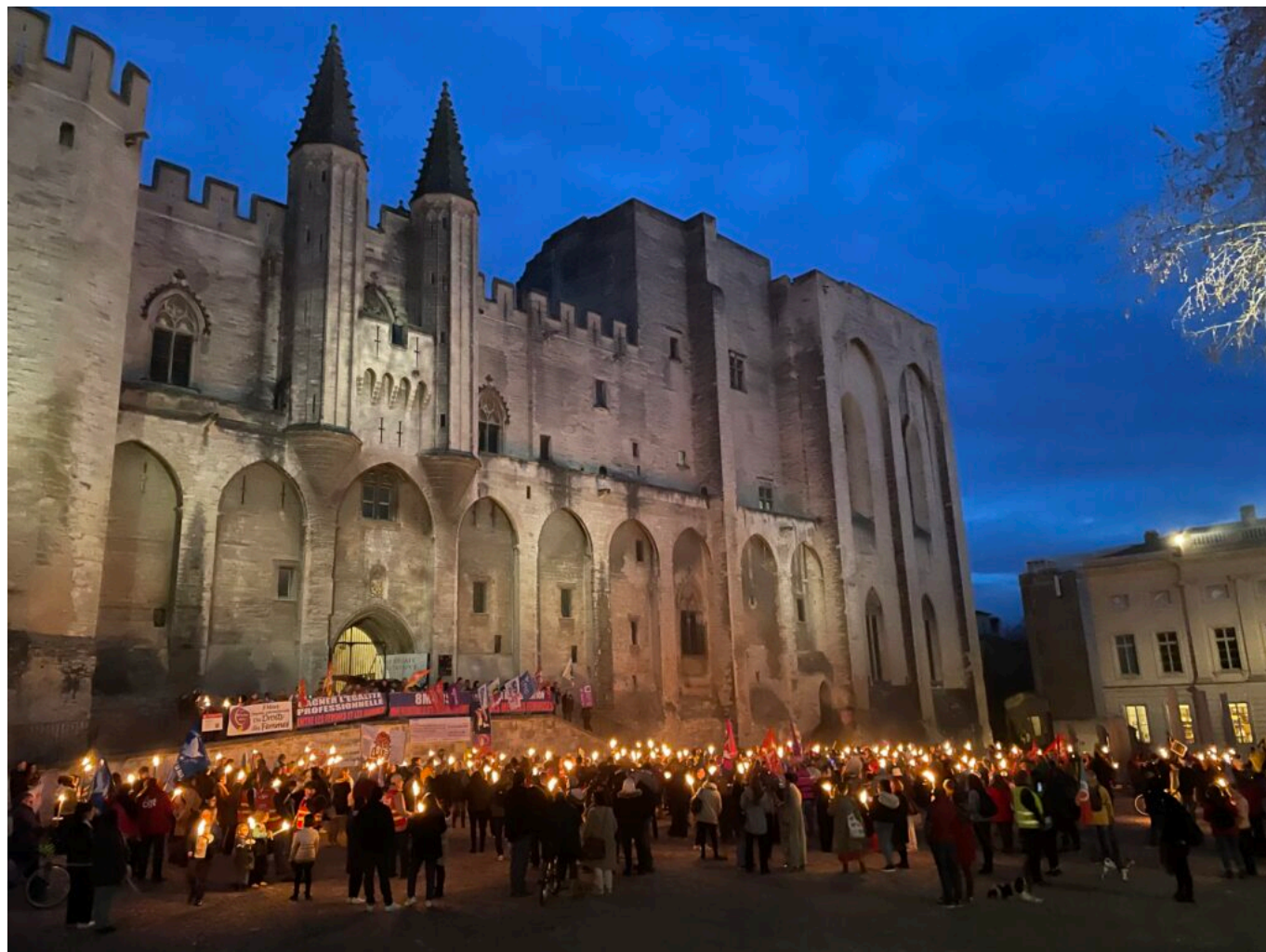
Manifestation au flambeau contre la réforme des retraites le soir du 8 mars devant le Palais des papes