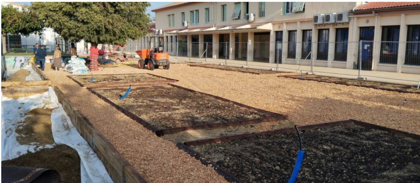
Le chantier de désimperméabilisation de l'école.