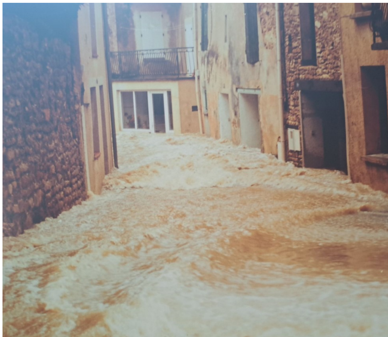
Le village lors des inondations de 2003.

Comme ancien chef de chantier, il est vrai qu'il sait comment réduire les coûts des chantiers en coordonnant l'implantation des réseaux (voirie, fibre optique, EDF, GDF, eau potable).