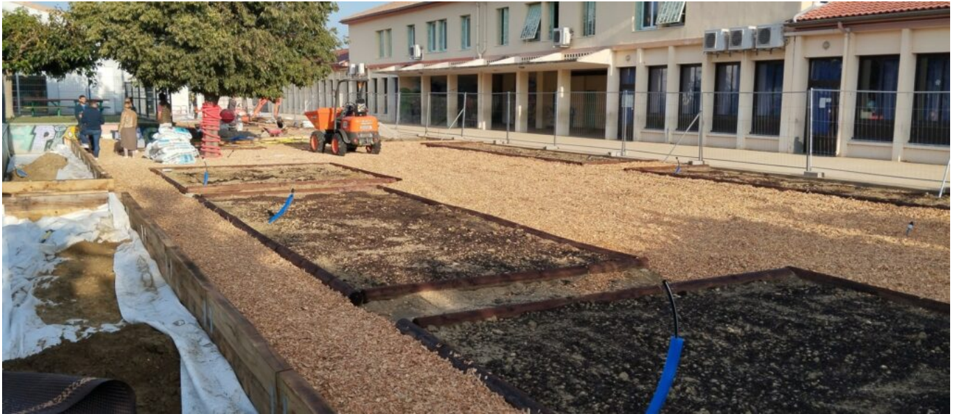
Le chantier de désimpermabilisation de l'école.