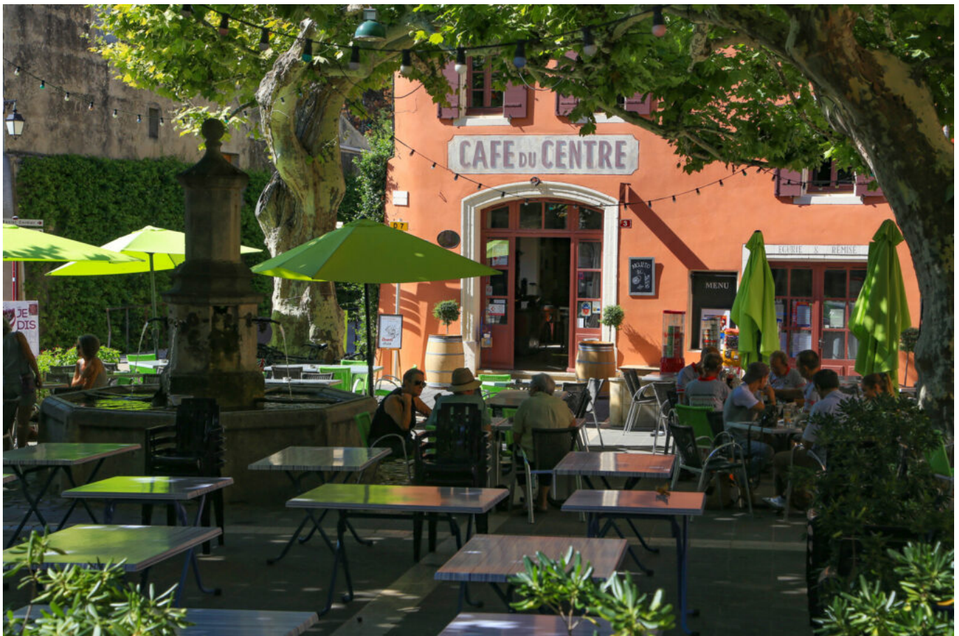
HOCQUEL A - VPA

Emblème de la culture française, il existe autant de manières de vivre un moment en terrasse qu'il existe de personnes. Parce que les terrasses sont omniprésentes au sein du paysage français, l'édition 2023 du sondage Ifop valorise la richesse de nos régions. Si les habitants de la région Nord-Ouest reconnaissent l'intérêt des terrasses ensoleillées du Sud de la France, ils défendent avec fierté les leurs. Ils sont ainsi 60% à estimer que c'est leur région qui se rend le plus en terrasse parmi les autres régions de France, juste derrière le Sud de la France. Le Nord-Ouest est la seule région de l'hexagone à revendiquer les terrasses comme incarnation du patrimoine culturel local, devant le patrimoine régional ou national. Au total, 22% des Français interrogés estiment même que la Bretagne possède les plus belles terrasses de France. Les natifs du Sud-Est et du Sud-Ouest sont ceux qui vantent le plus le mérite de leurs terrasses : 82% d'entre eux estiment qu'elles les rendent fiers de leur région, contre 77% en moyenne.