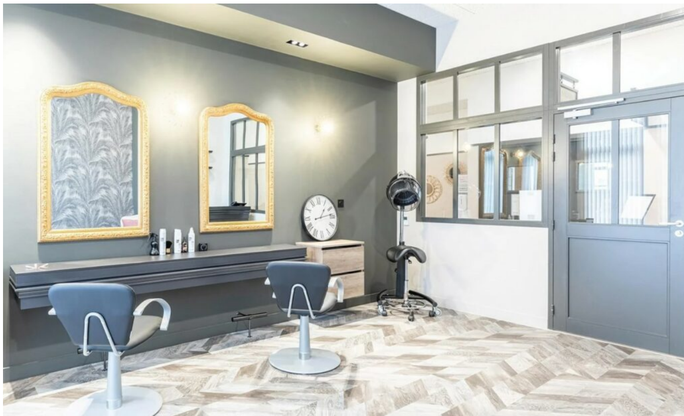
Le salon de coiffure et d'esthétique

accompagne les collectivités locales pour la réalisation de leurs opérations d'aménagement et participe ainsi au développement des zones urbaines. A travers ses filiales Ovelia , Student factory et Bikube , le promoteur exploite et gère des résidences seniors et étudiants ainsi que des résidences de coliving .