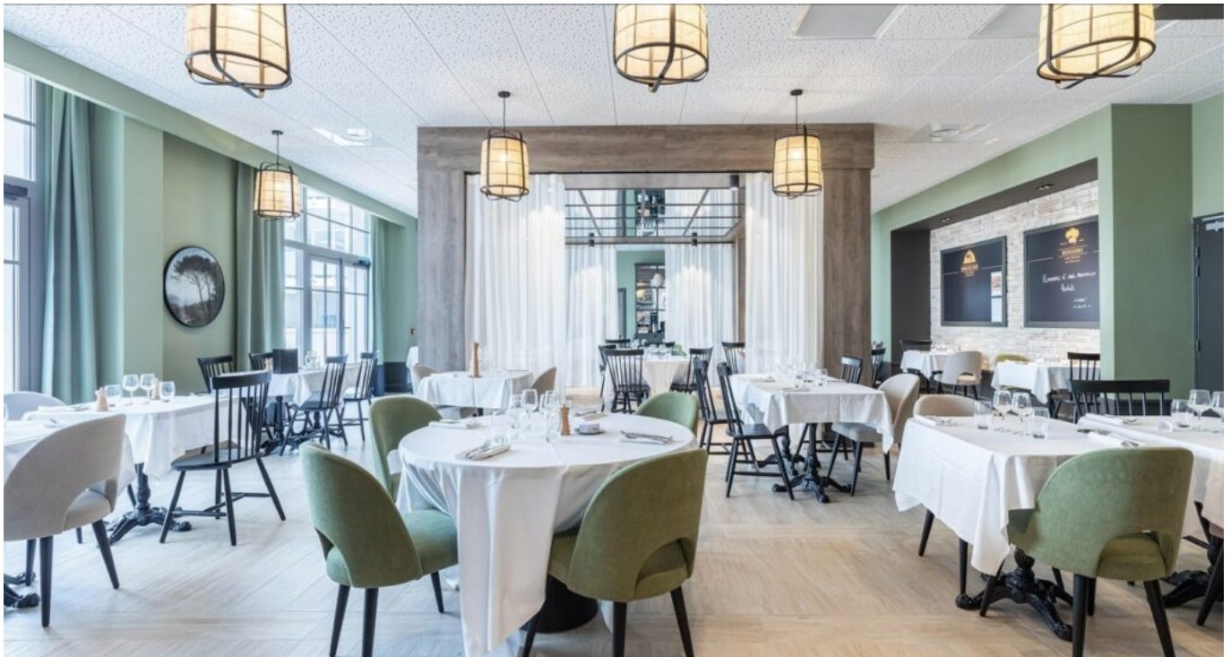
La salle de restaurant

Ecrit par Mireille Hurlin le 26 juin 2023