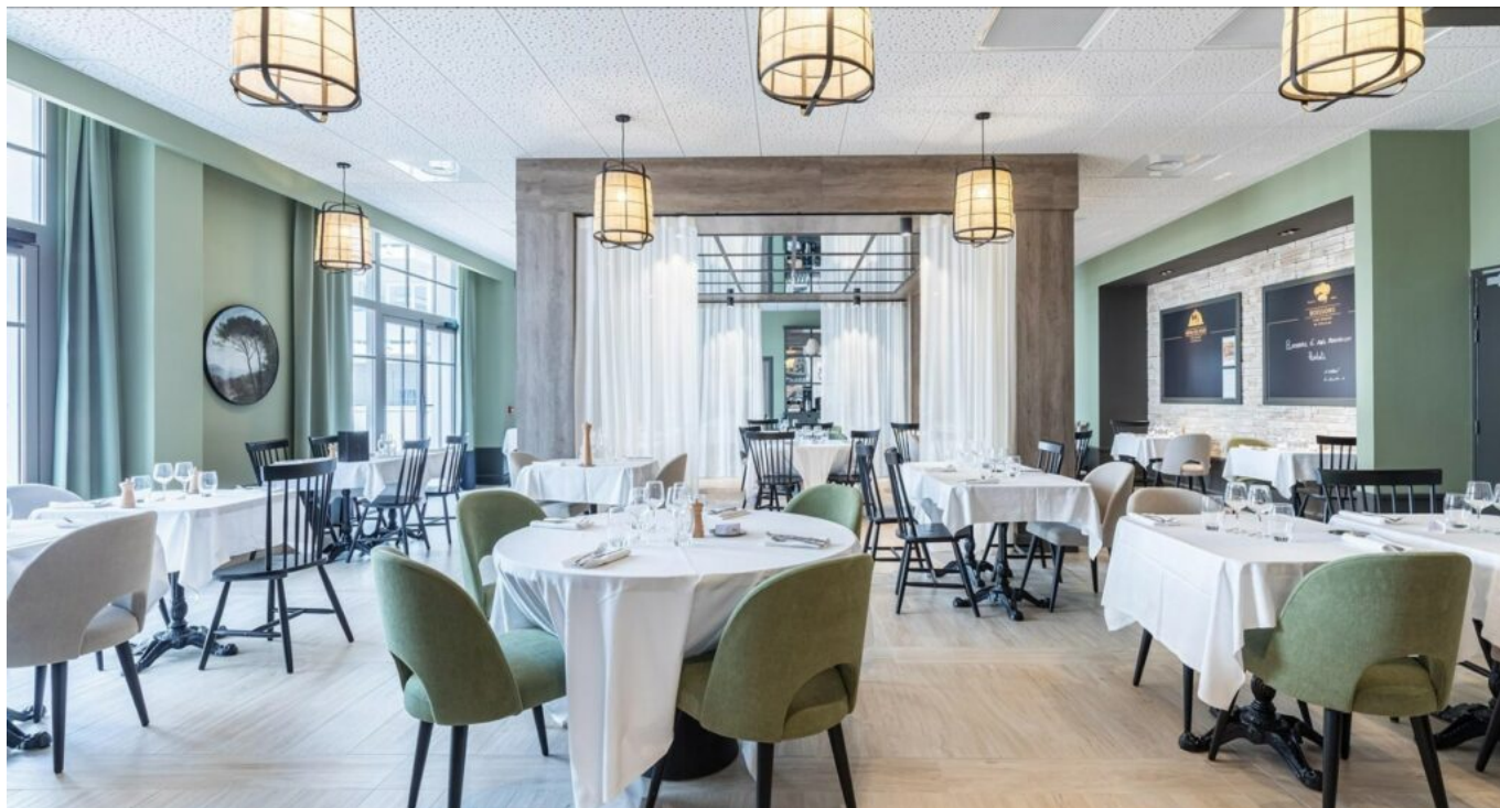
La salle de restaurant

Ecrit par Mireille Hurlin le 26 juin 2023