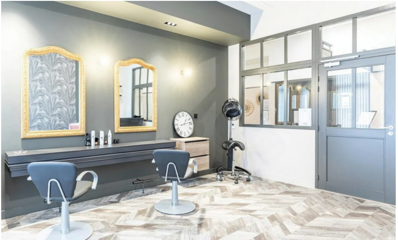
Le salon de coiffure et d'esthétique

accompagne les collectivités locales pour la réalisation de leurs opérations d'aménagement et participe ainsi au développement des zones urbaines. A travers ses filiales Ovelia , Student factory et Bikube , le promoteur exploite et gère des résidences seniors et étudiants ainsi que des résidences de coliving .