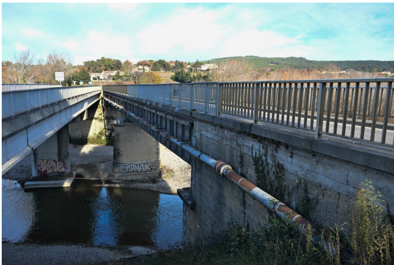
Le pont Valentin (à gauche) et le pont qui va être destiné à la véloroute (à droite).

Écrit par Vanessa Arnal le 3 janvier 2025