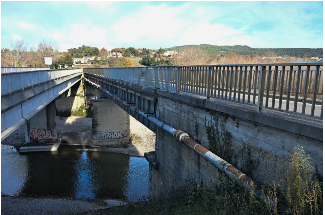
Le pont Valentin (à gauche) et le pont qui va être destiné à la véloroute (à droite).

Écrit par Vanessa Arnal le 3 janvier 2025