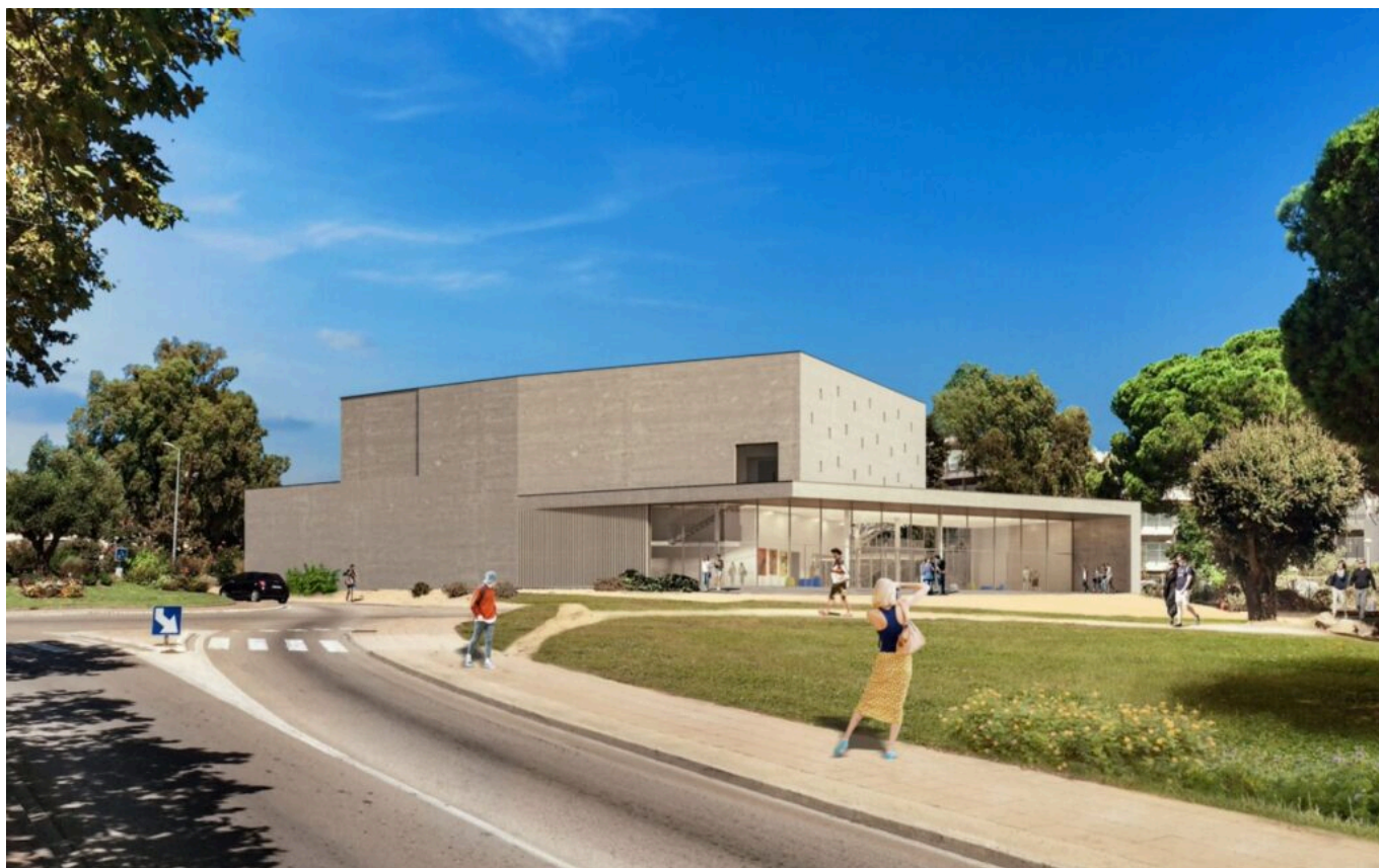
Ce à quoi devrait ressembler le bâtiment, une fois les travaux finis. ©Architecture Maria Godlewska

La première pierre de ce lieu culturel a été posée en octobre 2021 et les travaux devraient s'achever dans quelques semaines, à la fin du mois de mars.