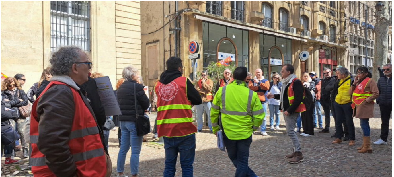
Un appel à une manifestation inter-syndicale et unitaire a été lancé pour le 3 avril à Avignon

Ecrit par Andrée Brunetti le 31 mars 2025