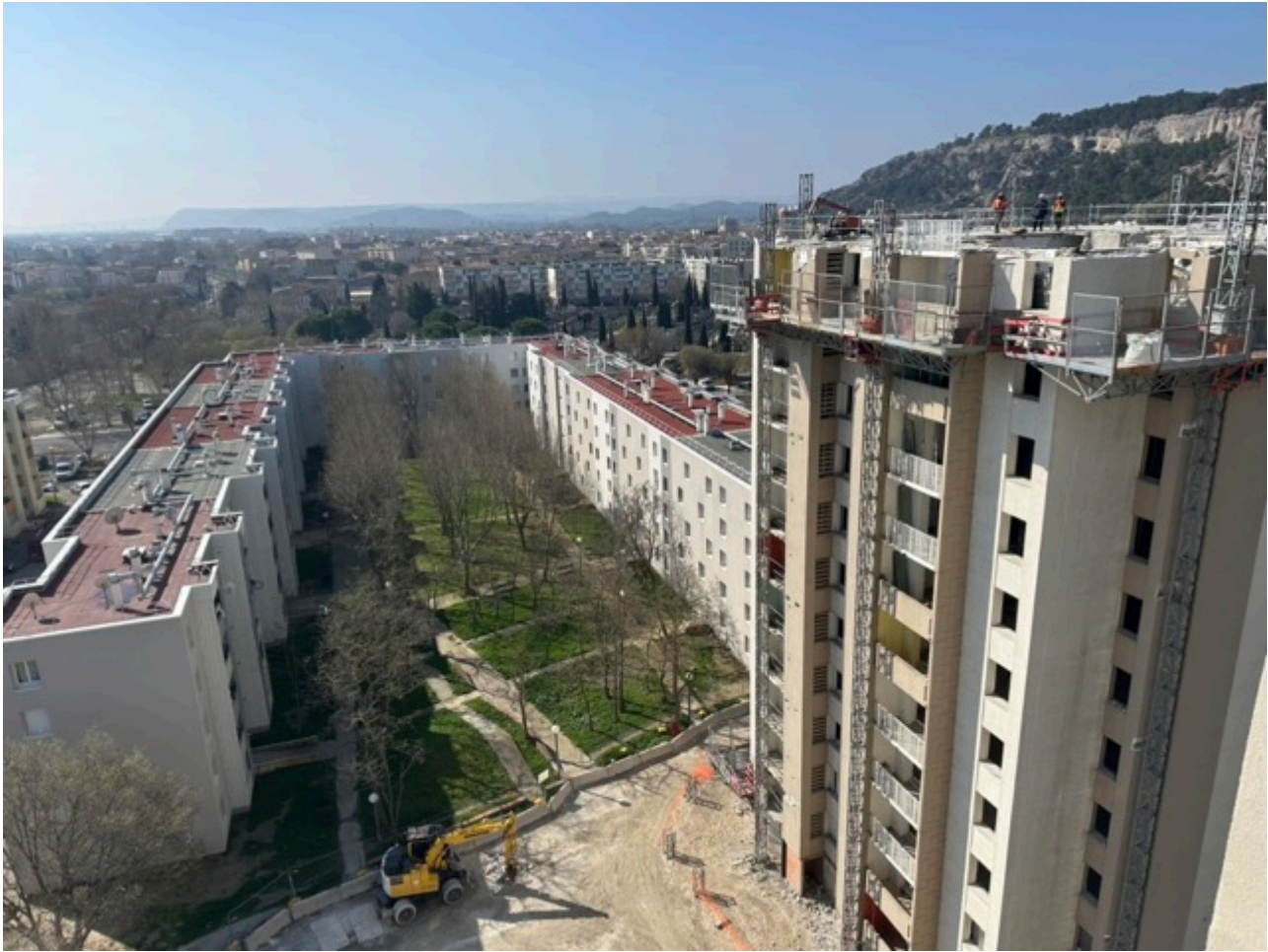
La Tour N vue depuis le 12e étage de la Tour D.