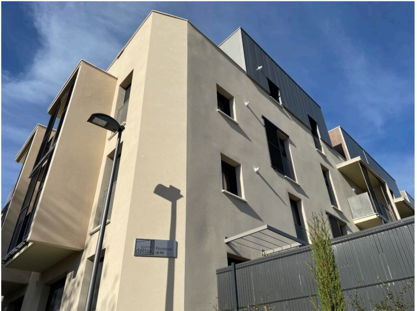
Le 110 à Cavaillon

Ecrit par Mireille Hurlin le 7 décembre 2023