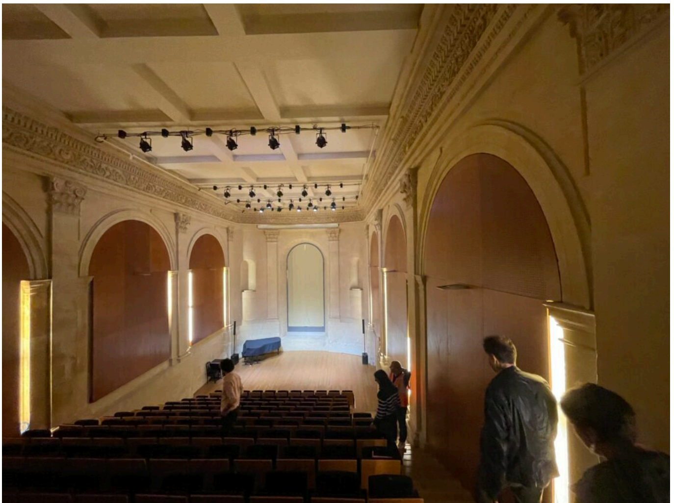
La salle de concert Rosa, ancienne chapelle

Le Conservatoire à rayonnement régional accueille plus de 3 000 élèves, dont 500 issus des écoles associées et propose des formations artistiques aux enfants comme aux adultes. Le bâtiment classé du XVIIIe siècle est racheté au Département -estimé par les Domaines à 1,52M€- par le Grand Avignon en 2005 et ouvert au public en 2007 après plus de 7M€ de travaux.