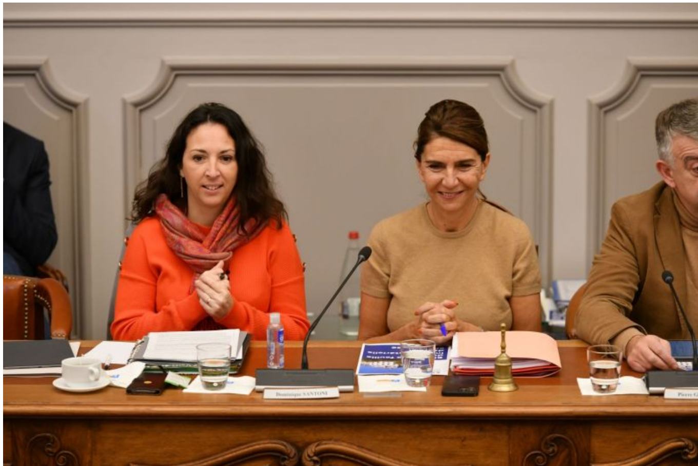
Violaine Démaret, préfète de Vaucluse (à gauche) et Dominique Santoni, présidente du Conseil départemental de Vaucluse.

9 politiques prioritaires et 5 projets structurants spécifiques au Vaucluse. »