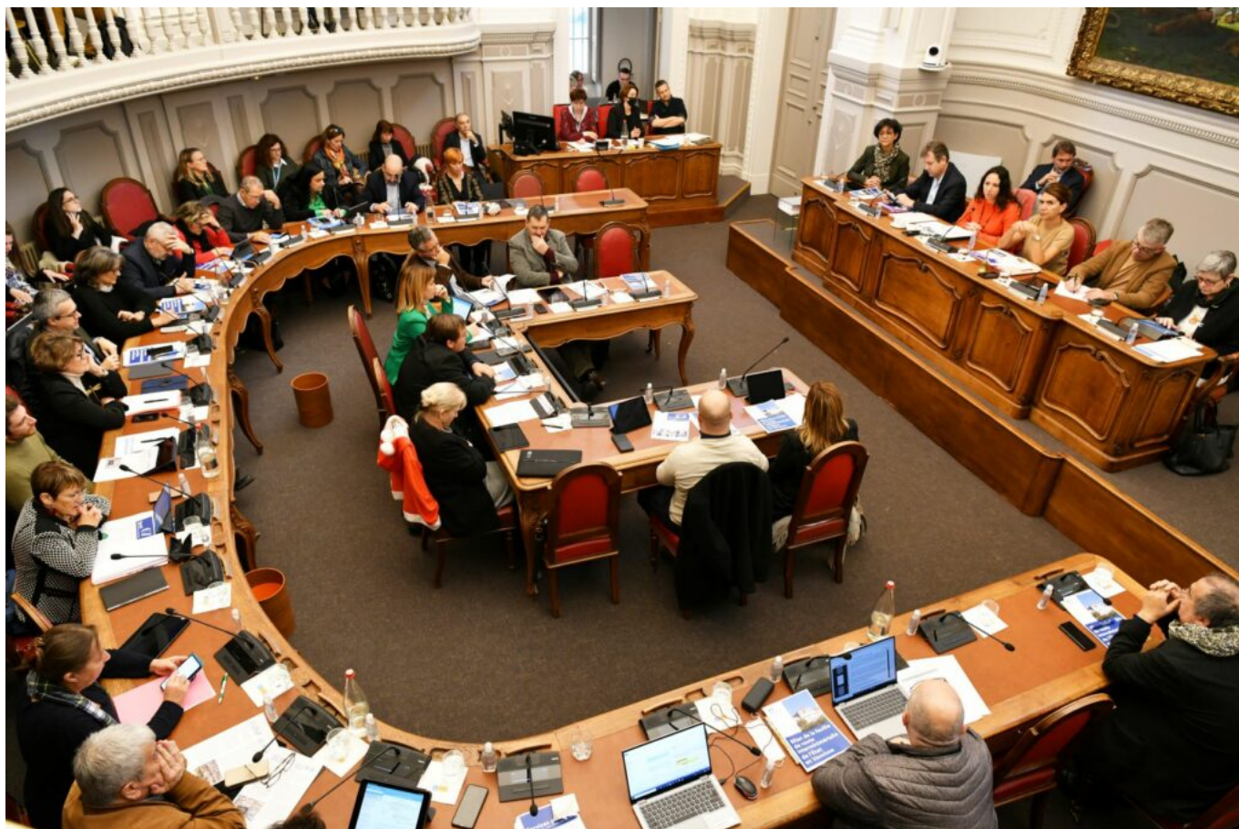
Les conseillers départementaux attentifs à la parole de la représentante de l'Etat en Vaucluse

La préfète continue de détailler sa feuille de route : pour l'éducation, il faut accélérer les efforts, doubler les effectifs dans les REP (Réseaux d'éducation prioritaire), pas plus de 24 élèves par classe et aussi offrir une scolarisation inclusive aux enfants handicapés, à ce jour le but de 90 unités d'inclusion est quasiment atteint. Pour lutter contre les déserts médicaux, les structures de soins doivent être démultipliées. Il existe 24 maisons de santé, dans le cadre du Covid, 20 centres de vaccination et de dépistage ont été mis en œuvre.