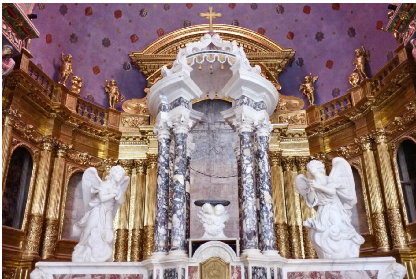
le retable

Ecrit par Didier Bailleux le 19 septembre 2024