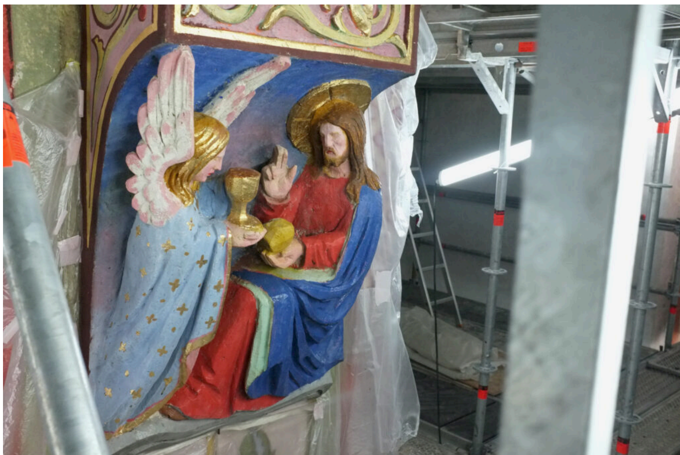
détail sculpture murale

Ecrit par Didier Bailleux le 19 septembre 2024