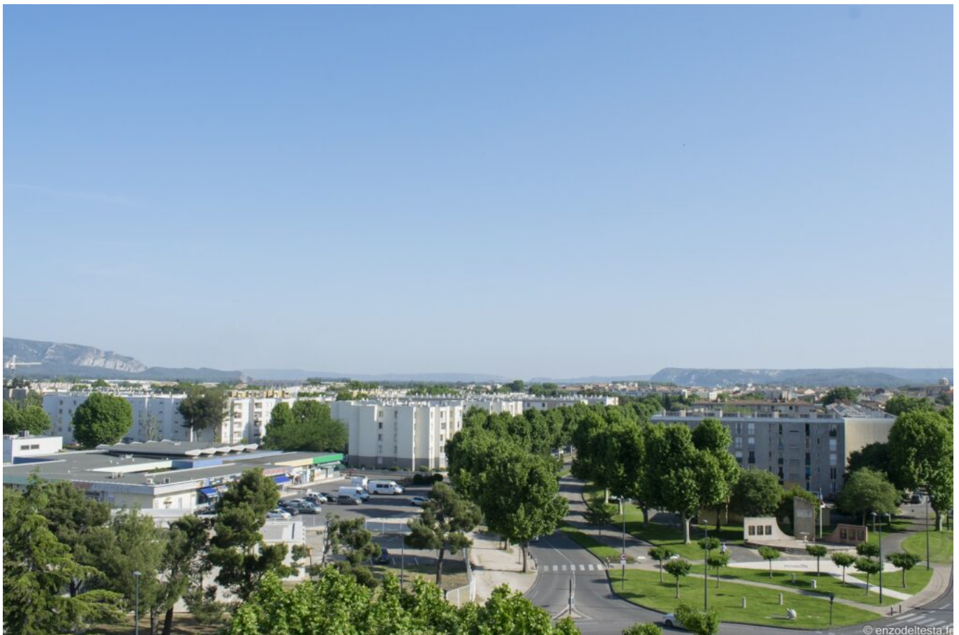
Vue du quartier du Docteur Ayme sans les 2 tours.

« La Ville de Cavaillon accompagnera chaque famille dans un relogement conforme à ses besoins, insiste le maire de la cité cavare. Nous avons également obtenu des financements supplémentaires pour que les réhabilitations à venir soient réalisées avec un haut niveau d'exigence environnementale (Bâtiments basse consommation). Les voiries et les espaces publics seront reconfigurés, sécurisés et embellis par la commune. Par ailleurs, j'ai acté l'implantation forte de services publics en cœur de quartier. Cet engagement a sans nul doute contribué à convaincre l'Anru du bienfondé du dossier de Cavaillon. Cela concernera notamment la construction de nouveaux locaux pour le centre social, France Services et le Point Justice, d'un nouvel accueil pour les jeunes, d'une salle multi-activités, d'une halte-garderie par l'agglomération et d'un nouveau plateau sportif. »