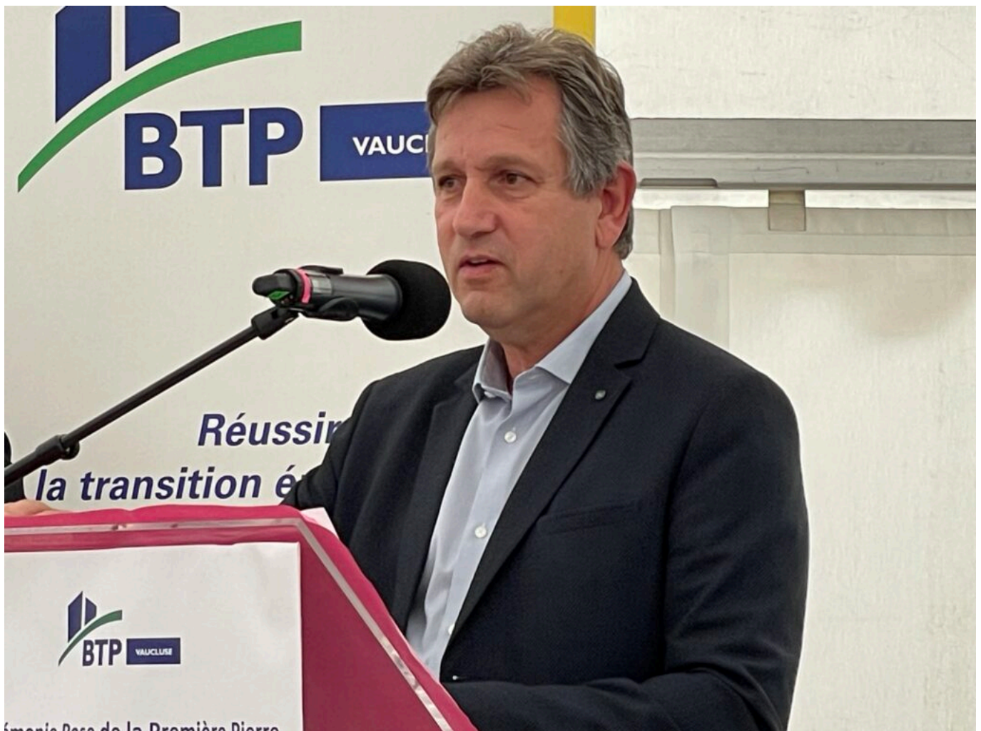
Thierry Lagneau Copyright MMH

s'est ouverte à sa première rentrée. La bibliothèque Renaud-Barrault, bâtiment des années 70, passoire énergétique a été totalement rénovée. Le parvis de la gare Centre d'Avignon avec l'aide de la Région et la SNCF, a également été complètement réinterprété. Ces projets emblématiques de renouveau représentent des dizaines de millions d'investissement et non pas du déficit public mais de l'activité pour nos entreprises. Ces réalisations maintiennent l'attractivité de nos territoires parce que les élus locaux font le pari de leur territoire. Ce sont aussi des entreprises, des hommes et des femmes du BTP, des architectes qui ramènent le beau dans la ville, ce qui est une dimension importante.»