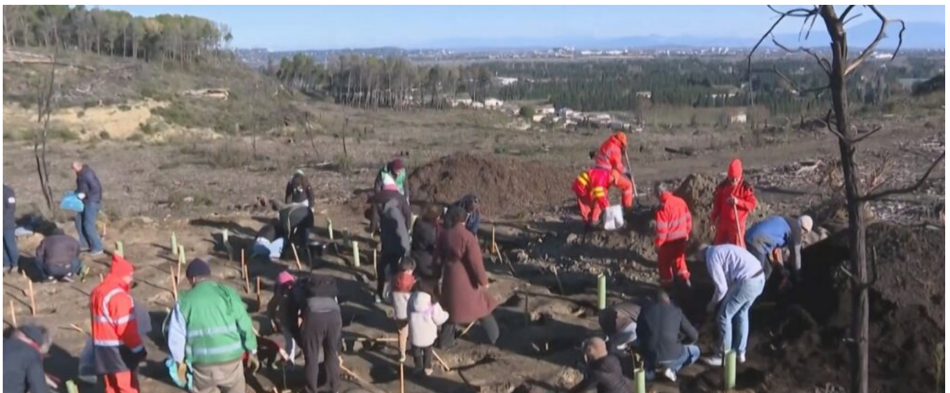
Les premières plantations de feuillus lors de la première opération test menée en partenariat avec

Jean-Christophe Daudet, maire de Barbentane