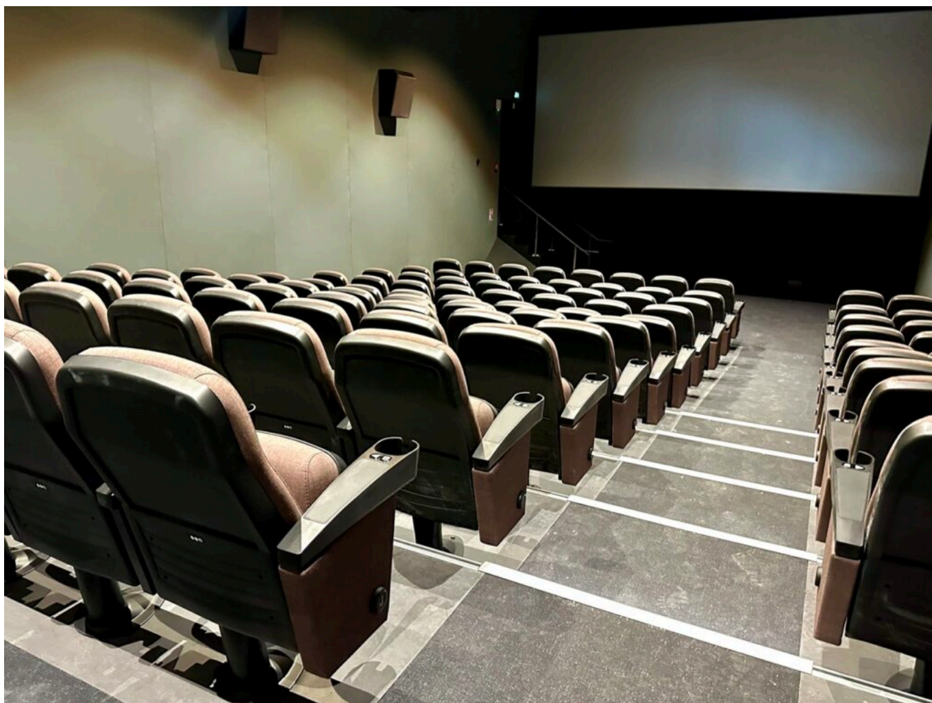
La salle 2 (100 places)