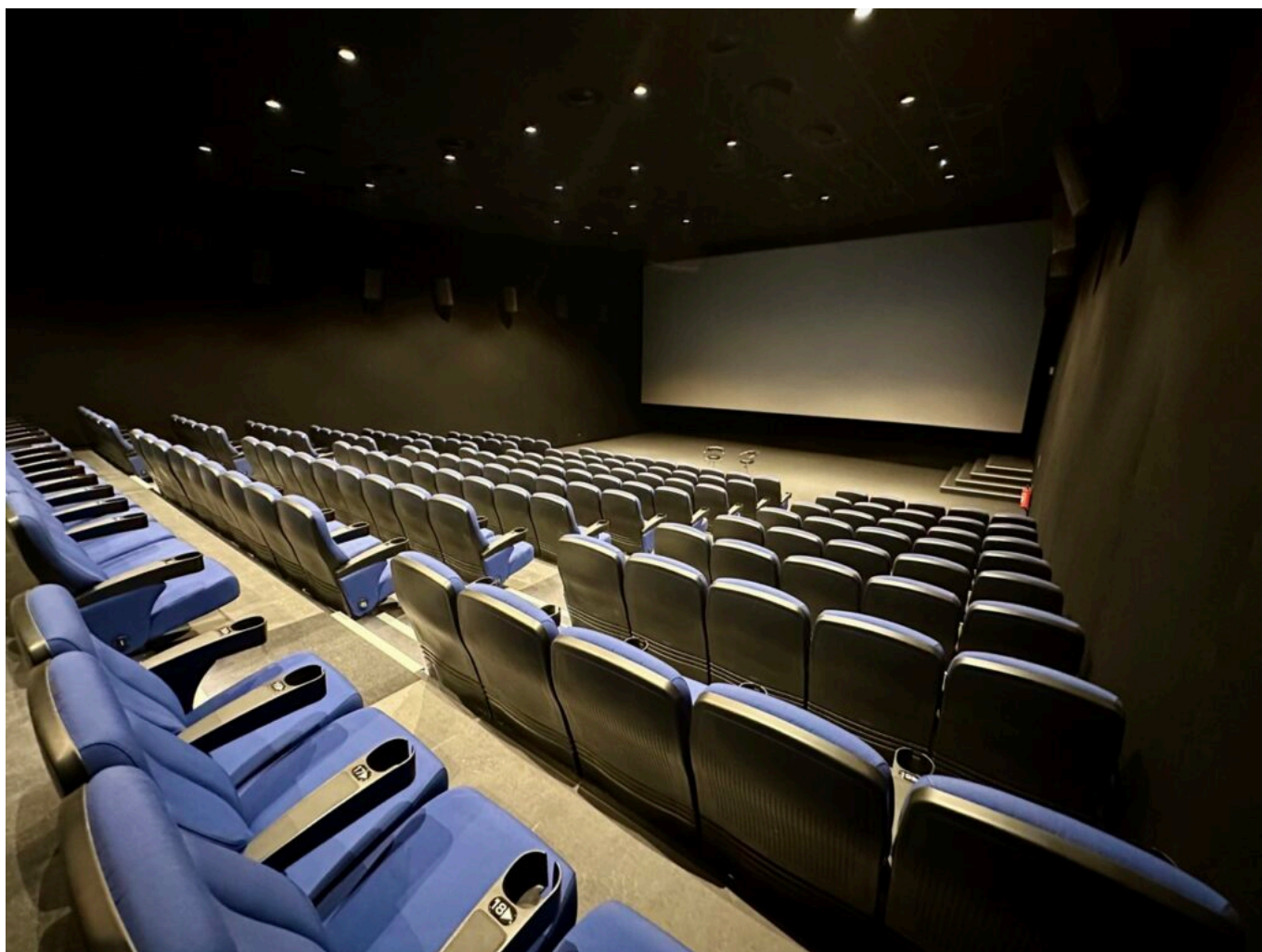
La salle 3 (187 places)