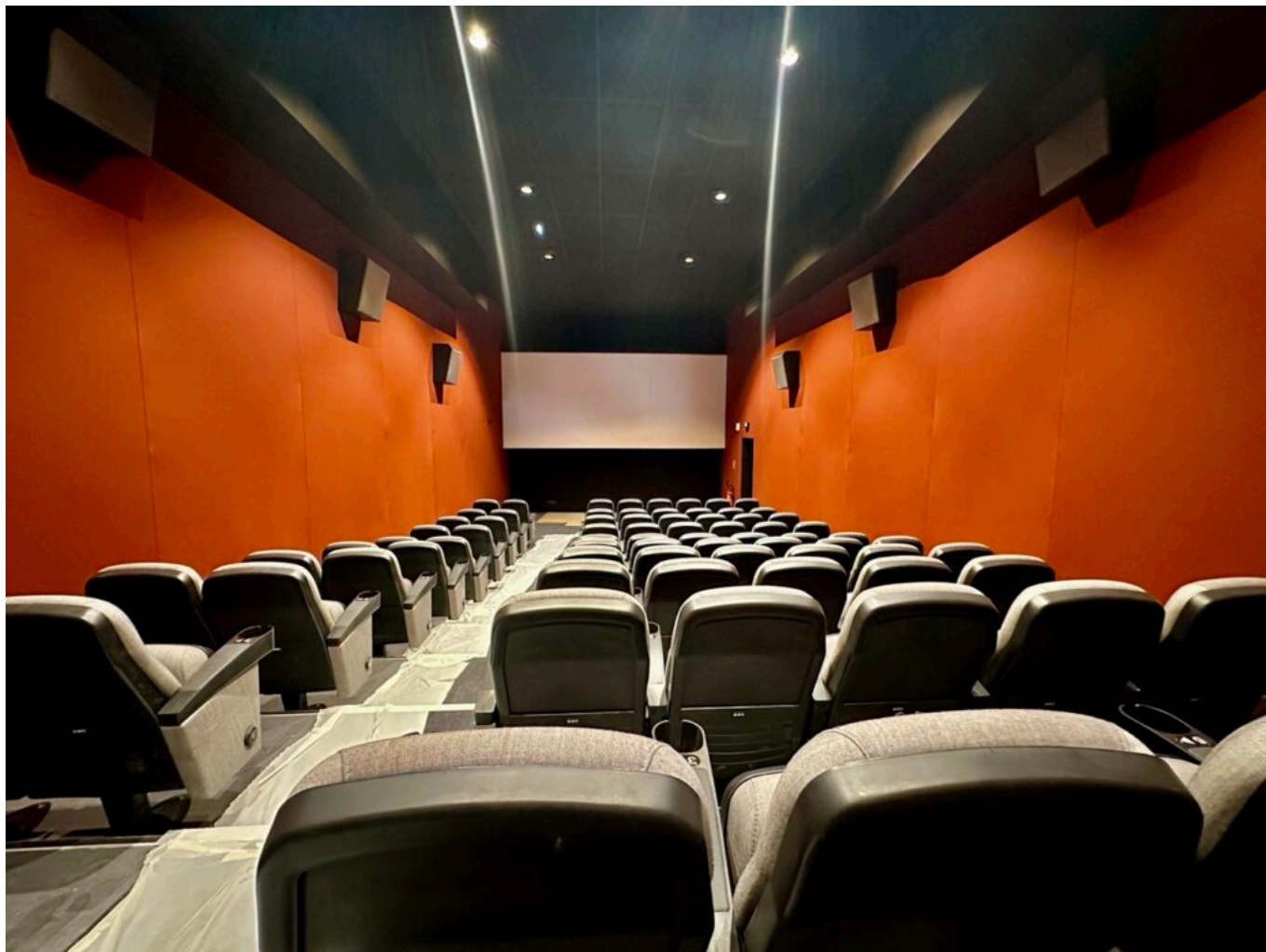
La salle 1 (80 places)