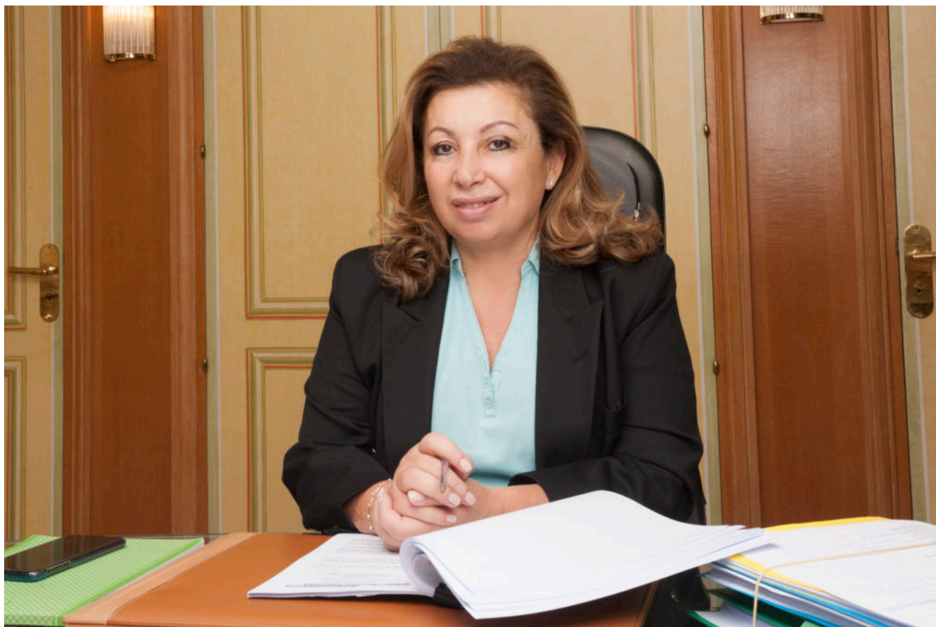
A la tête de la conférence générale depuis janvier

« C'est encore trop tôt pour en tirer de réelles conclusions ! Les différentes aides étatiques mises en place au plus fort de la crise sanitaire, à l'image des PGE (Prêts Garantis par l'État) ou encore les reports de charges sociales et fiscales ont permis de maintenir à flot bon nombre d'entreprises et d'éviter une situation catastrophique. Les aides de l'État sont une chose, mais derrière, s'il n'y a pas une gestion de la part des chefs d'entreprise, cela ne sert à rien. Il leur est nécessaire d'anticiper et les mesures aujourd'hui mises en œuvre le permettent. Les juges consulaires ont tous les moyens pour épauler et sauver les entreprises. »