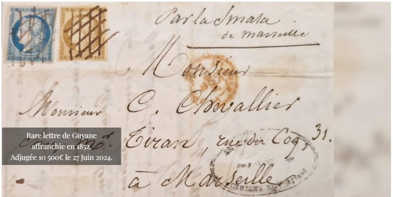
Rare lettre de Guyane affranchie en 1852. Adjudgée 10 500€ le 27 Juin 2024.