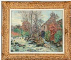
Armand GUILLAUMIN (1841-1927) : Moulin Charraut (dit Bouchardon). Huile sur toile signée en bas à droite, titrée sur le châssis et numérotée 21314. Dim. : 65,5x71 cm....