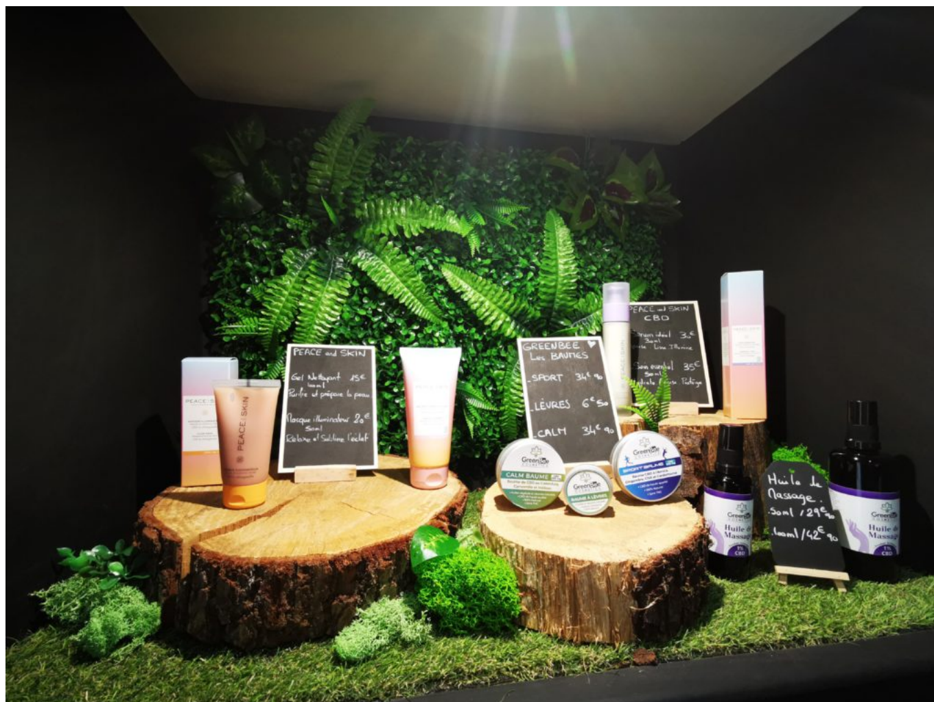
La gamme cosmétique, soin, massage, masque, baumes.

Ecrit par Linda Mansouri le 3 octobre 2021