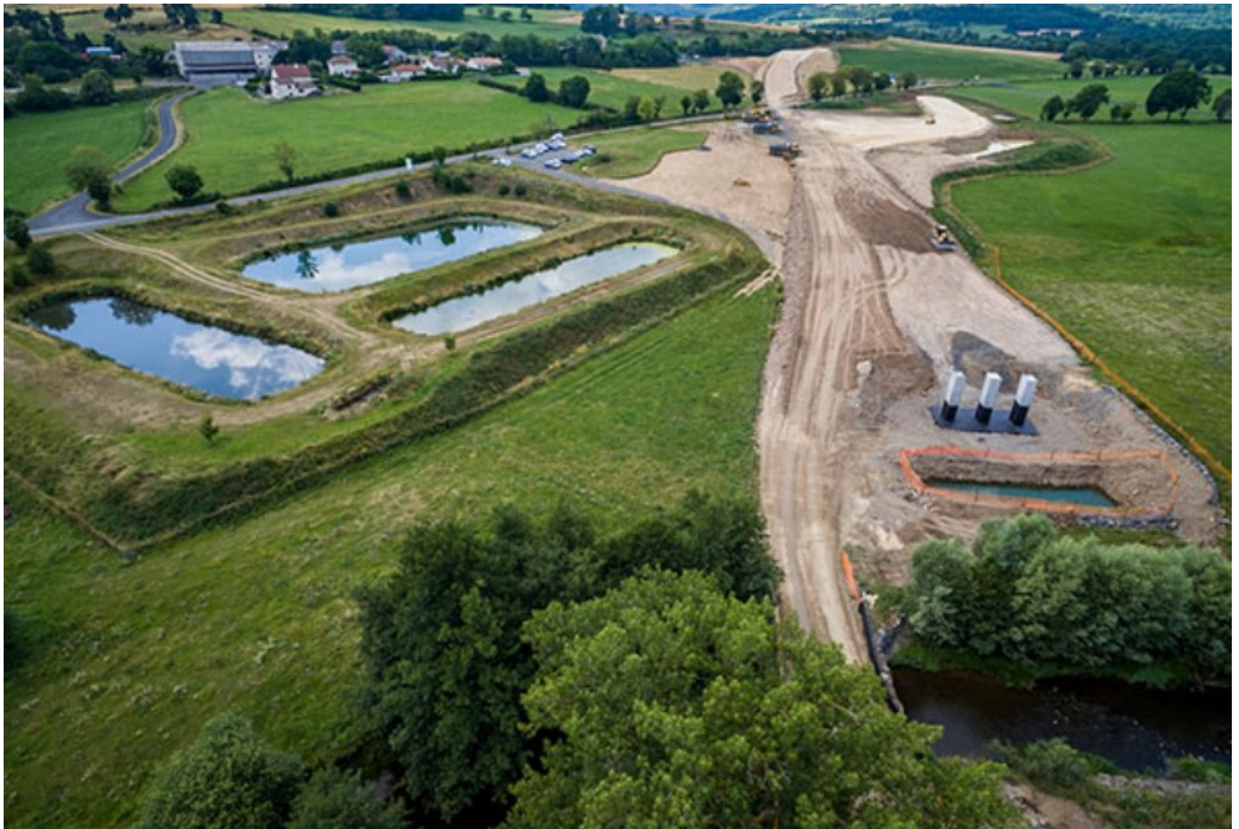
Travaux NGE

Écrit par Mireille Hurlin le 7 juillet 2022