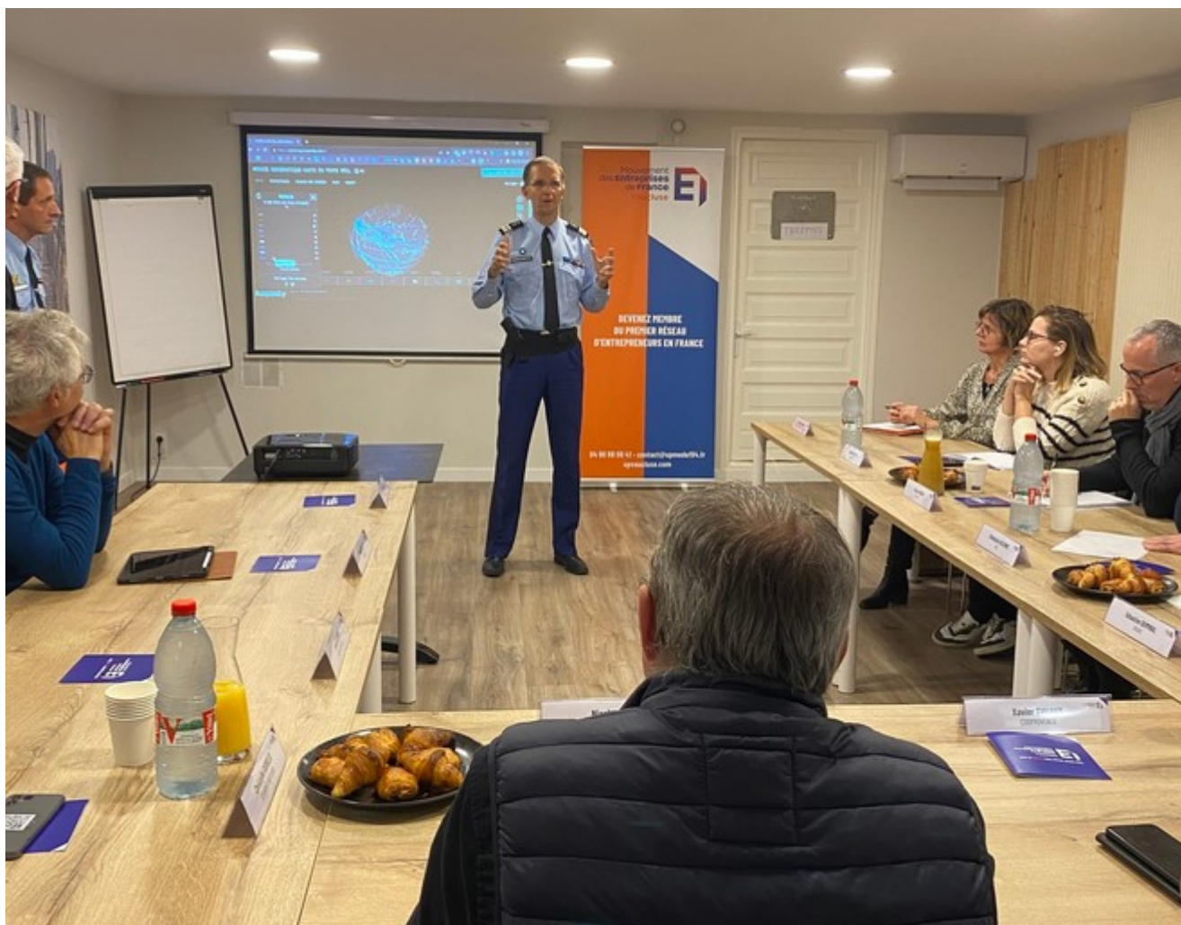
Sensibilisation à la cybersécurité des adhérents du Medef 84 avec la gendarmerie de Vaucluse.

Ecrit par Echo du Mardi le 1 décembre 2023