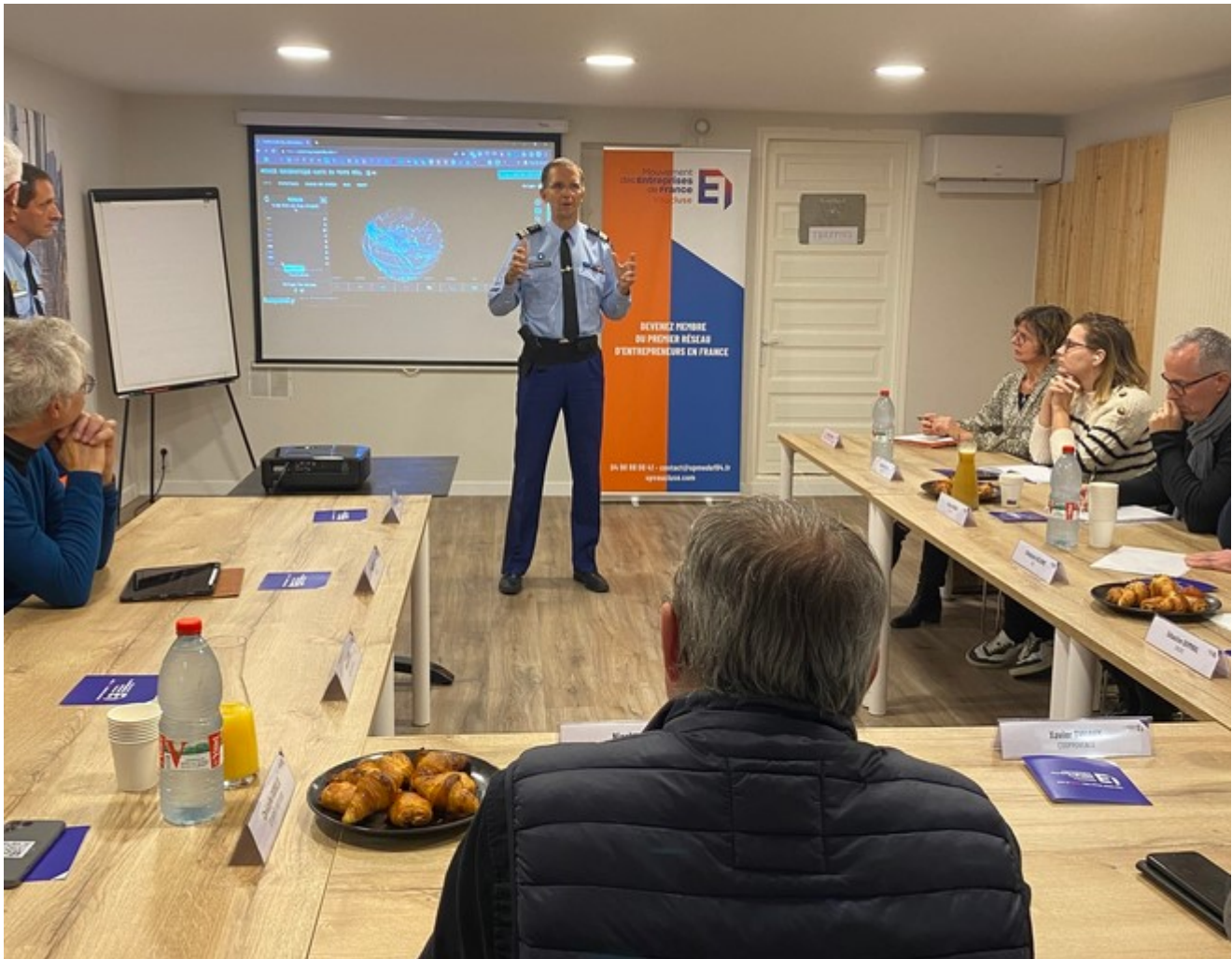
Sensibilisation à la cybersécurité des adhérents du Medef 84 avec la gendarmerie de Vacluse.

Ecrit par Echo du Mardi le 1 décembre 2023