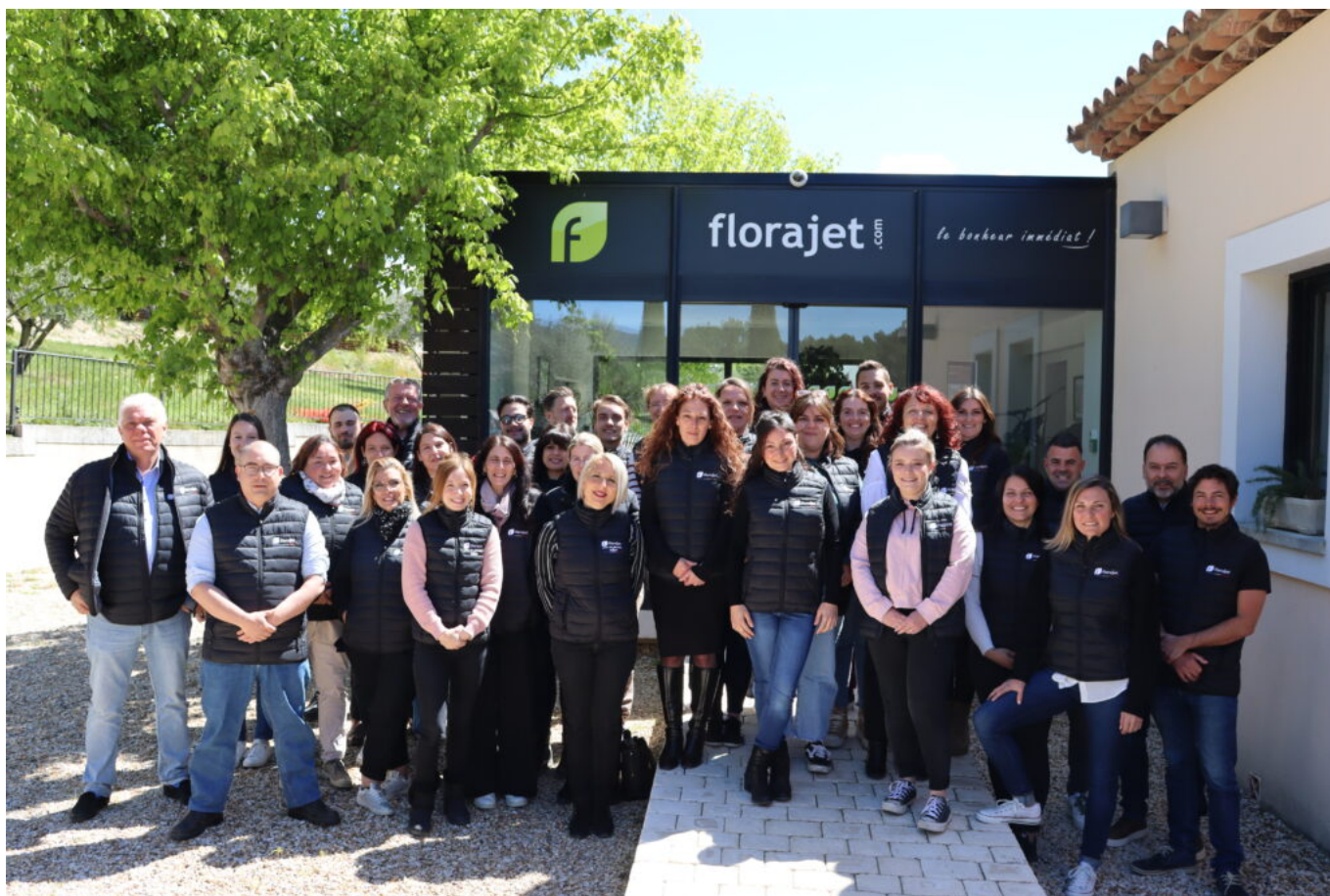
L'équipe de Florajet à Cabrières d'Aigues.

*Étude réalisée par Florajet en collaboration avec Opinionway auprès d'un échantillon de 1 048 personnes représentatif de la population Française âgée de 18 ans et plus, du 3 au 6 mai 2024. Opinionway a réalisé cette enquête en appliquant les procédures et règles de la norme ISO 20252