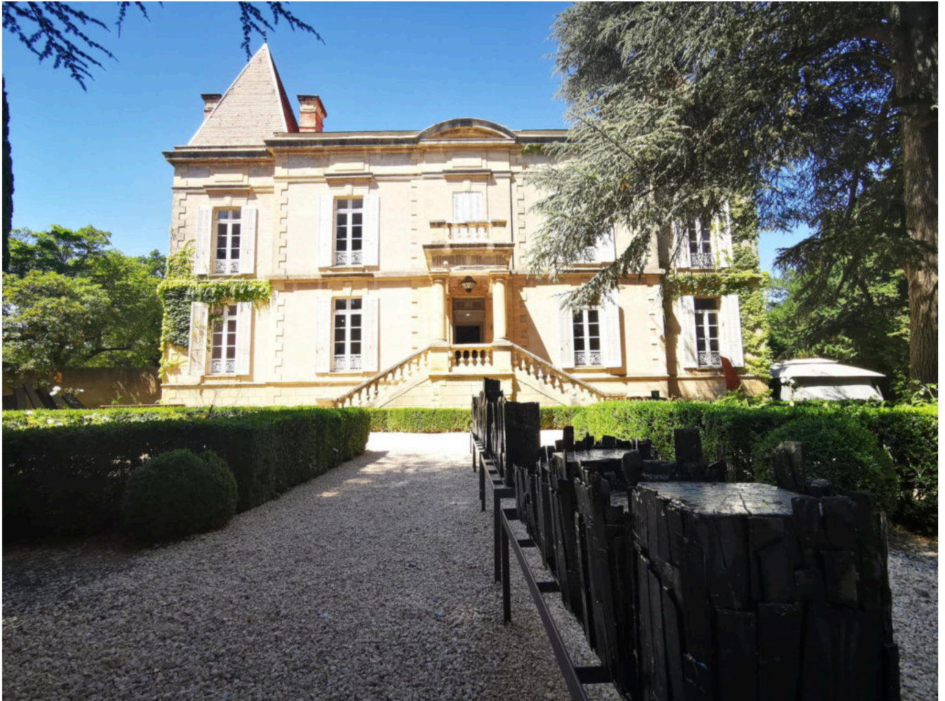
Château de Bosc

Ecrit par Linda Mansouri le 22 juillet 2021