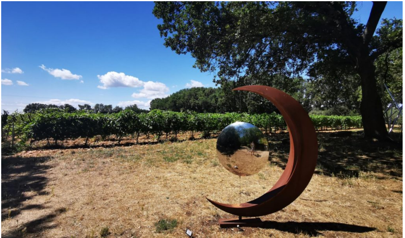
Château de Bosc

Ecrit par Linda Mansouri le 22 juillet 2021