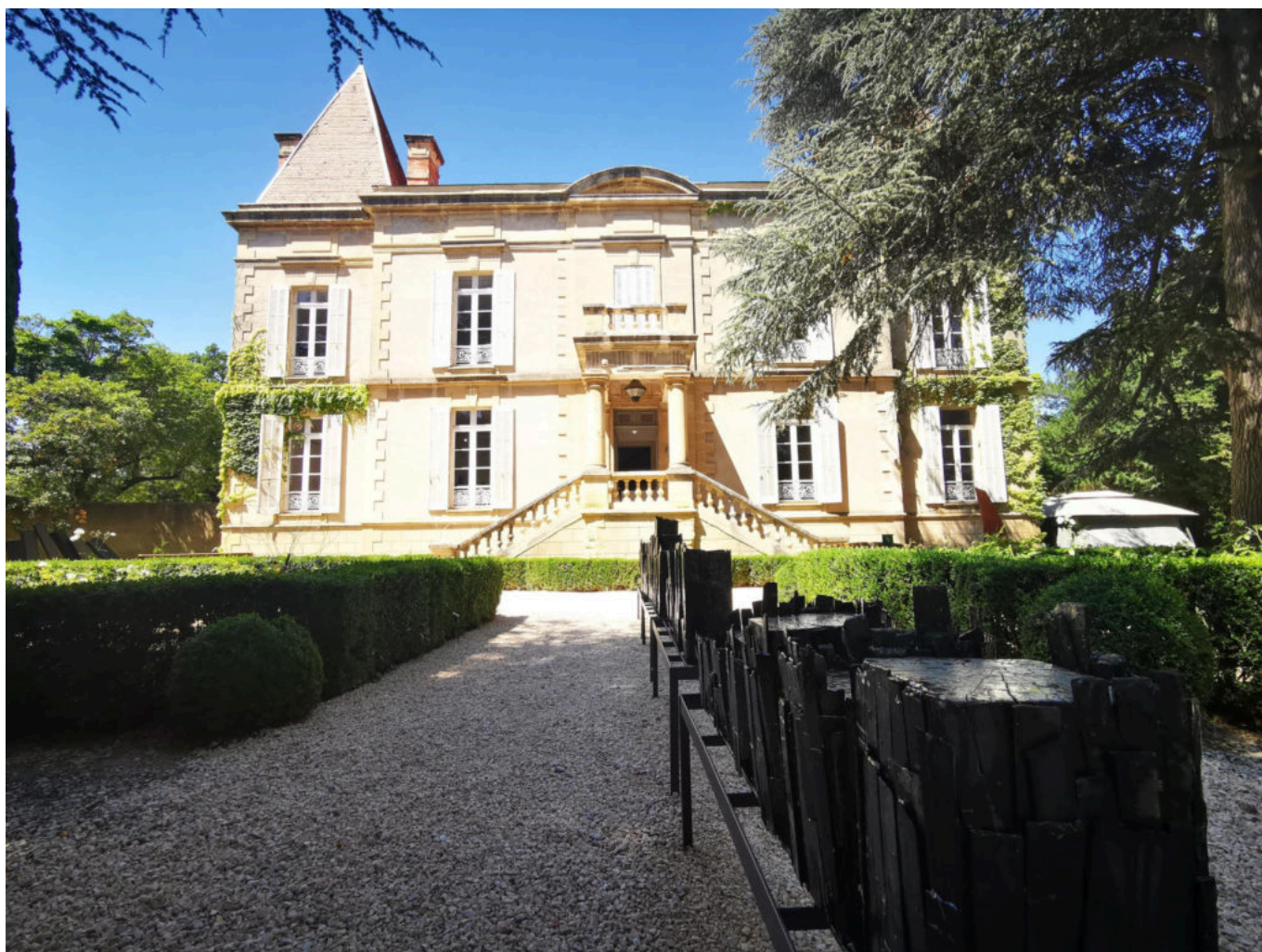
Château de Bosc

Ecrit par Linda Mansouri le 22 juillet 2021