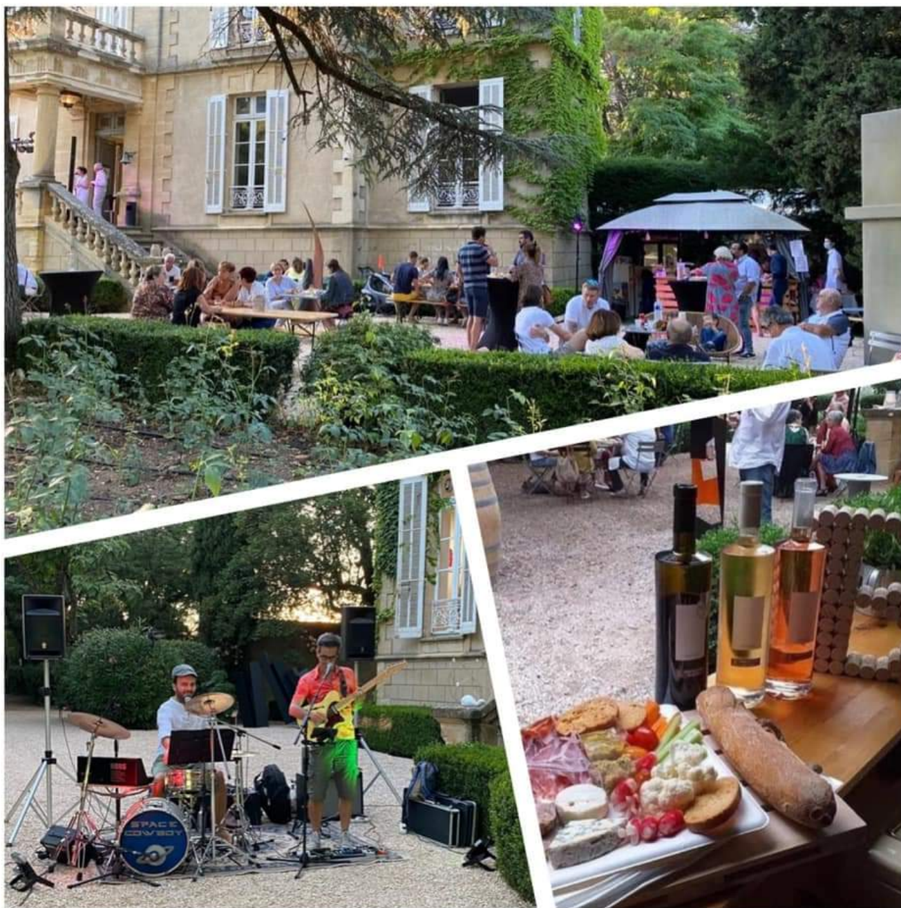
Photo : château de Bosc.