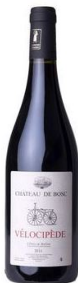
Le Vélocipède 2019