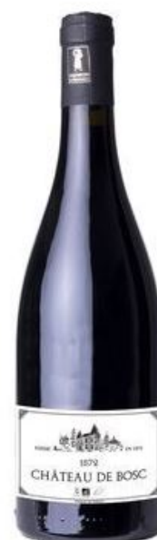
Château de Bosc Rouge 2019