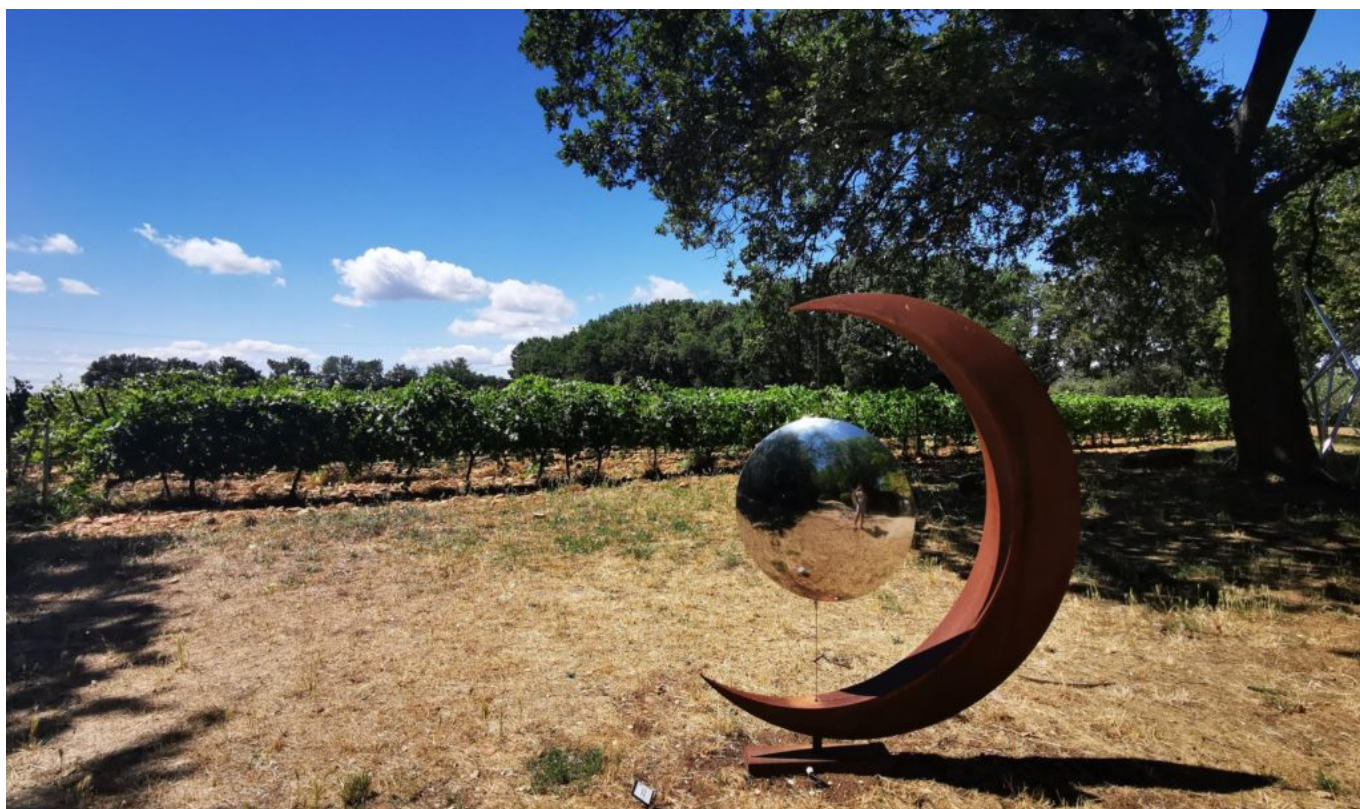
Château de Bosc

Ecrit par Linda Mansouri le 22 juillet 2021