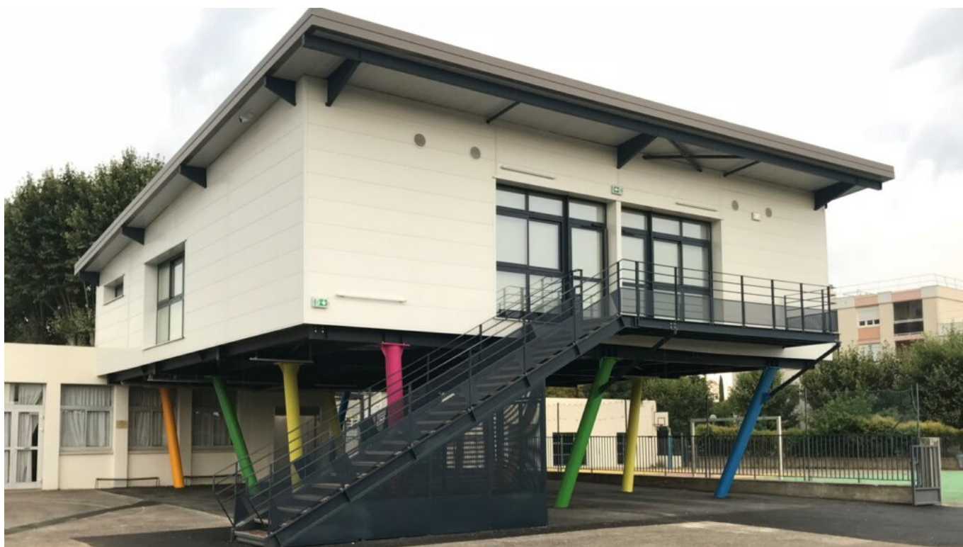
L'école Giono à Tarascon.

Ecrit par Laurent Garcia le 9 novembre 2022