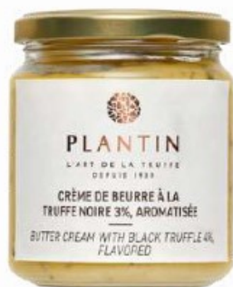
Crème de beurre à la truffe noire 3%