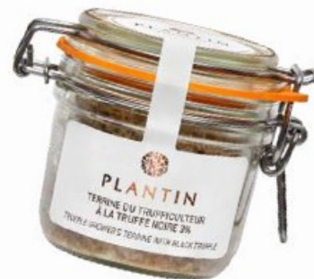
Terrine du trufficulteur au foie gras entier et à la truffe noire 3%