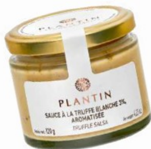
Sauce à la truffe blanche 3%

Ecrit par Mireille Hurlin le 21 août 2024