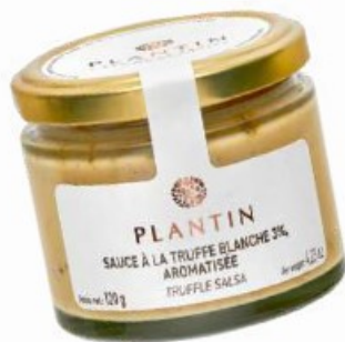
Sauce à la truffe blanche 3%

Ecrit par Mireille Hurlin le 21 août 2024