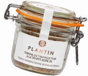
Terrine du trufficulteur au foie gras entier et à la truffe noire 3%