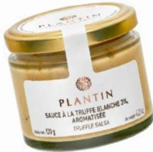
Sauce à la truffe blanche 3%

Ecrit par Mireille Hurlin le 21 août 2024