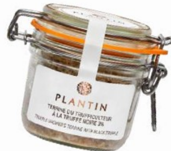
Terrine du trufficulteur au foie gras entier et à la truffe noire 3%