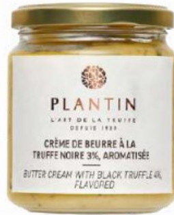
Crème de beurre à la truffe noire 3%