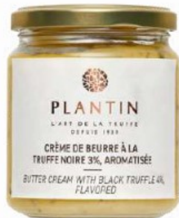
Crème de beurre à la truffe noire 3%