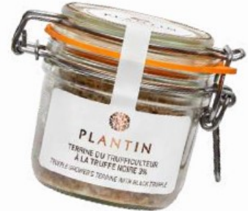
Terrine du trufficulteur au foie gras entier et à la truffe noire 3%