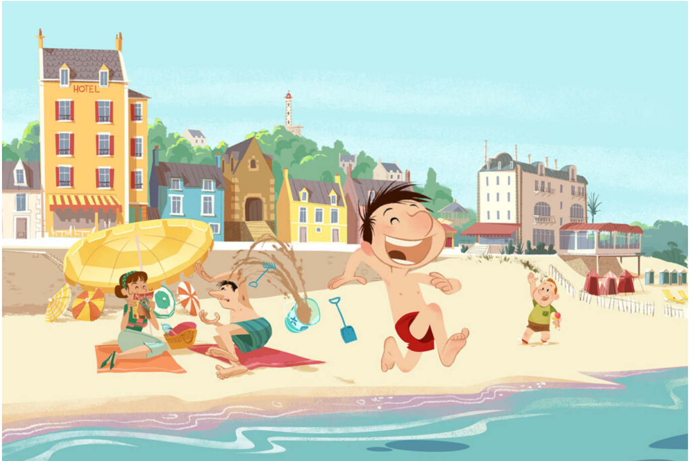
Le Petit Nicolas

« Nous avons l'espoir que l'humain reste prépondérant à nos métiers ».