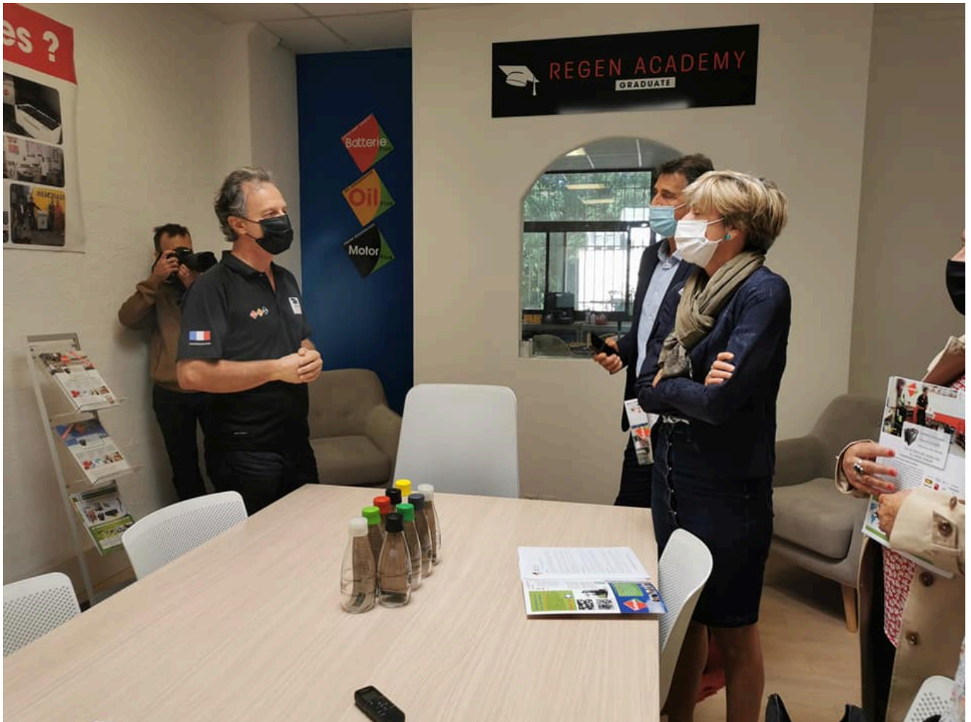
Visite de Cécile Helle, Maire d'Avignon au siège de Be Energy.

Ecrit par Linda Mansouri le 13 octobre 2021