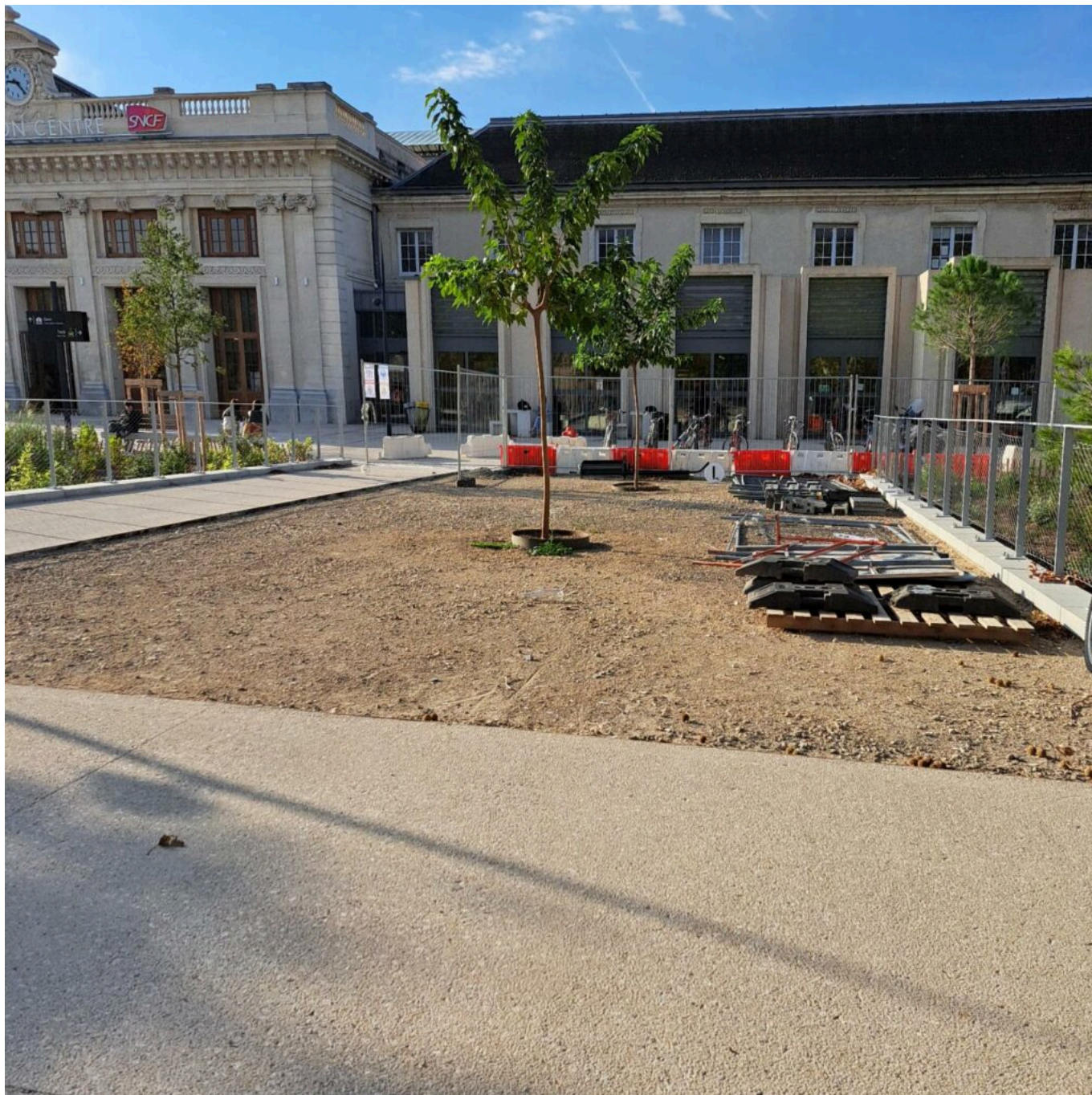
La terrasse côté gare.

après de la SNCF, on a eu l'autorisation de chantier fin août 2024 en procédure accélérée et depuis, on nous a remis les clés et on fonce avec l'architecte avignonnais Andrea Bortolus et Citadis ».