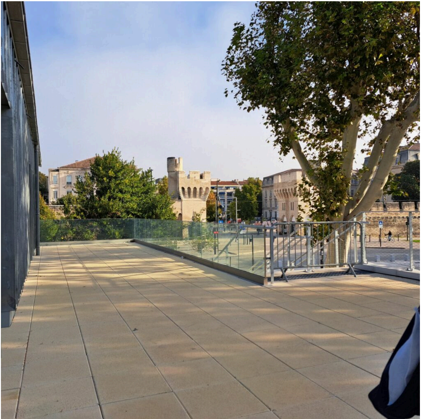
La terrasse côté rempart.

Ecrit par Andrée Brunetti le 9 octobre 2024