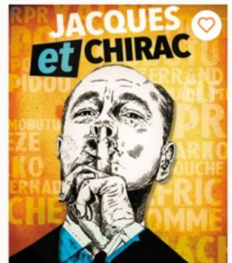
Jacques et Chirac