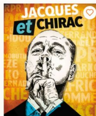
Jacques et Chirac